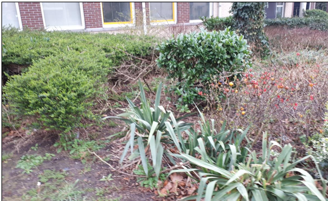
Figuur 4.1 Potentieel voortplantingsbiotoop van egel.

In het plangebied zijn potentiële rust- en voortplantingsplaatsen van egel aangetroffen. Het betreft de groenelementen rondom de bebouwing (zie figuur 4.1) en rondom de parkeerplaats. Egels maken gebruik van dichte stuiken als rustplaats.