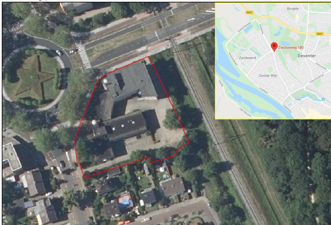
Figuur 1.1 Plangebied (rode contour) en locatie (kaartuitsnede)

Het plangebied ligt aan de Zwolseweg 180 in Deventer (zie figuur 1.1). Het voormalige kantoorgebouw staat nu grotendeels leeg, de onderste verdieping is tijdelijk in gebruik als school. Rondom de bebouwing en de aanliggende parkeerplaats zijn enkele groenelementen aanwezig, het betreft voornamelijk tuinbeplanting. De bebouwing wordt in zijn geheel afgebroken, waarna binnen het plangebied een appartementencomplex wordt gerealiseerd. Bij de voorgenomen ontwikkelingen wordt afgeweken van het vigerende bestemmingsplan.