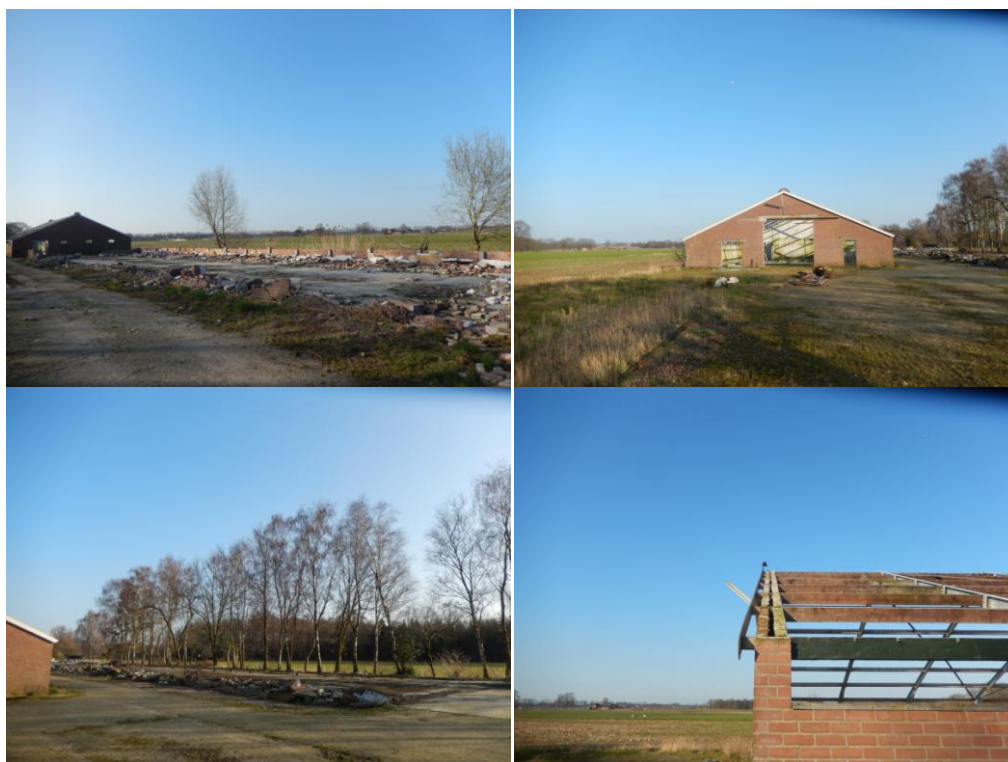
Figuur 1: foto's van het plangebied