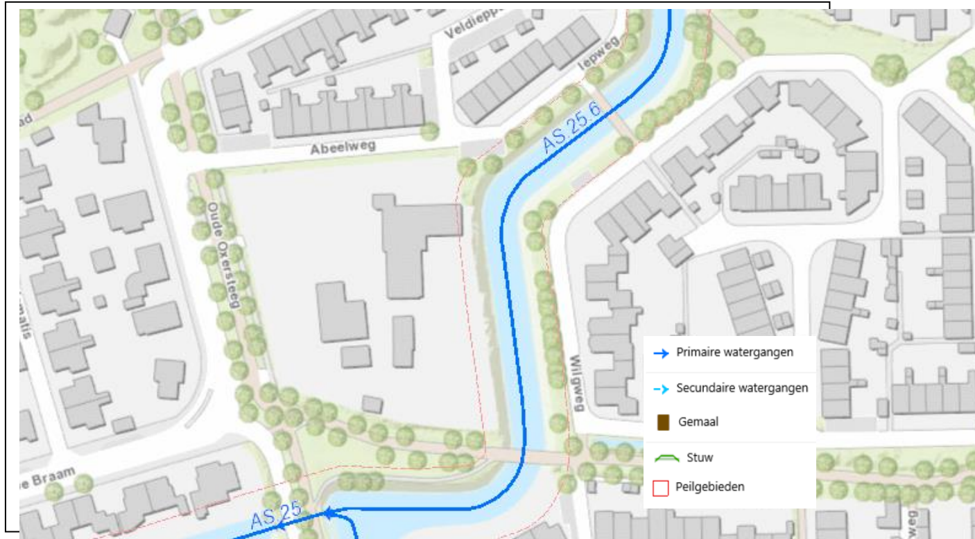
Figuur 1 Kaartbeeld bestaande waterhuishouding rond het plangebied.

Het plan ligt in het stroomgebied Ankersmit. Rond het plangebied ligt een primaire watergang die in het beheer van het waterschap is. Het peilgebied heeft een maximumpeil van NAP +/- 5 m. Dit peil is de instelhoogte van het kunstwerk. Lokaal kunnen er verschillen optreden in het peil afhankelijk van de afstand tot de instelhoogte.