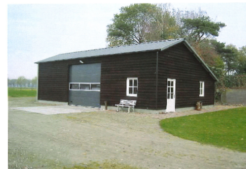
Referentiebeeld voor nieuwbouw en verbouw

Te verbouwen schuur, gedeeltelijk behoud bestaande schuur Afmetingen: 11.95 x 15 m Oppervlakte: 179 m2