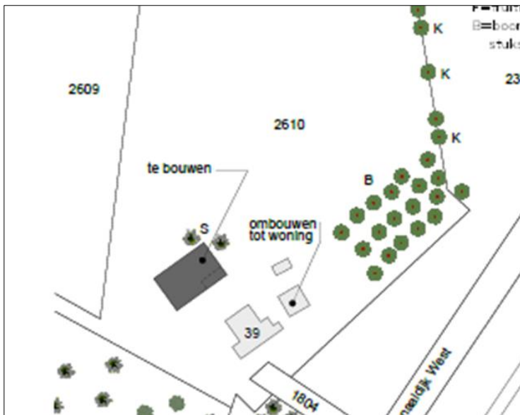
Plattegrond van het wenselijk eindbeeld.

Het voornemen bestaat om de schuur intern te verbouwen tot woning en een nieuwe schuur in het plangebied te realiseren. Om de nieuwe schuur te bouwen dienen de overkapping met houtopslag en de kapschuren gesloopt te worden. De nieuwe schuur wordt gebouwd op de slooplocatie. Aangenomen wordt dat een deel van de bestaande erfverharding verwijderd en vervangen wordt en dat er nieuwe erfverharding wordt aangelegd. Op onderstaande afbeelding wordt een plattegrond van het wenselijk eindbeeld weergegeven.