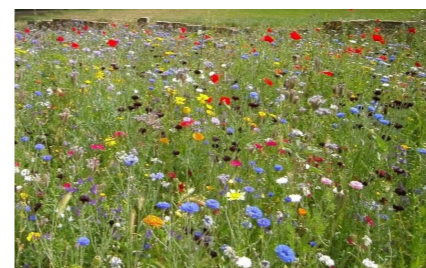
Bloem- en kruidenrijke groen- strook langs beiden zijden oprit