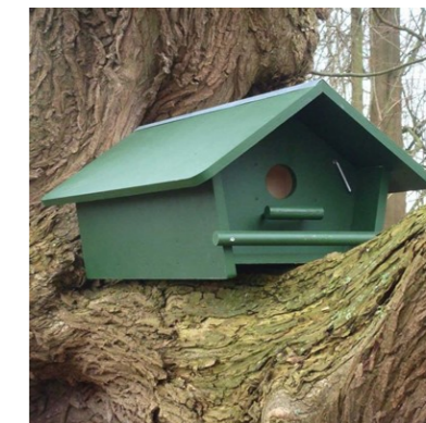
Nestkast steenuil in één van de twee bomen op de grens van het natuurgebied en woonperceel.