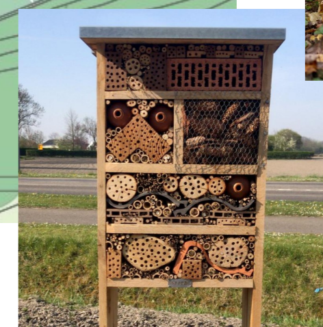
Insectenhotel in de achtertuin