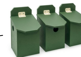
Plaatsing 3 nestkasten voor huismussen aan gevel woning (noordzijde)