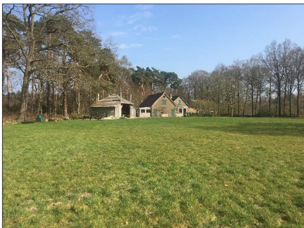
Veldmuizen kunnen een rust- en voortplantingsplaats bezetten in holen en gaten in het grasland.

Door het uitvoeren van grondverzet wordt mogelijk een grondgebonden zoogdier gedood en wordt mogelijk een vaste rust- en/of voortplantingsplaats beschadigd en vernield. De betekenis van het plangebied als foerageergebied voor grondgebonden zoogdieren neemt, door het bebouwen en verharderen, af.