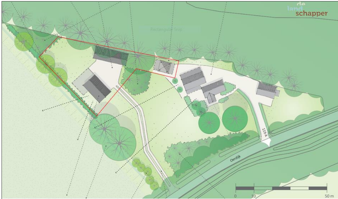
Plattegrond van het wenselijke eindbeeld.

Het voornemen bestaat woning met bijgebouw te bouwen en nieuwe natuur aan te leggen. De hooiberg blijft behouden en er worden geen bomen geveld bij uitvoering van de voorgenomen activiteiten. Nadien wordt het erf ingericht met diverse beplanting. Op onderstaande afbeelding wordt een plattegrond van het wenselijke eindbeeld weergegeven.