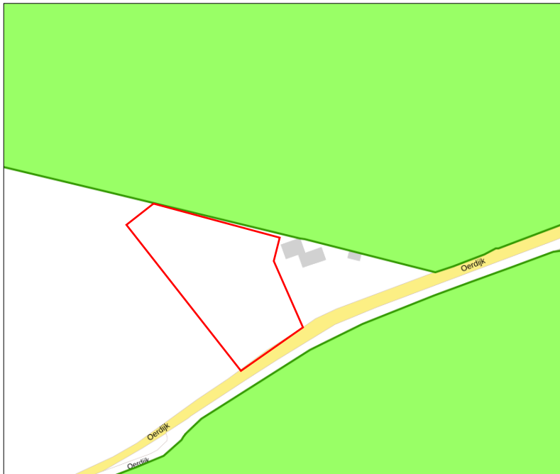
Ligging van Natuurnetwerk Nederland in de omgeving van het plangebied. De begrenzing van het plangebied wordt met de rode lijn aangeduid. Gronden die tot Natuurnetwerk Nederland behoren worden met de groene kleur op de kaart aangeduid.