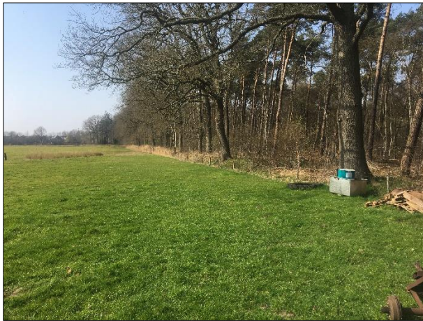
Potentiële nestlocatie van houtduif in de zomereiken aan de noordzijde van het plangebied.

Het plangebied behoort tot functioneel leefgebied van verschillende vogelsoorten. Vogels benutten het plangebied hoofdzakelijk als foerageergebied en vermoedelijk nestelen er jaarlijks vogels in de zomereiken aan de noordzijde van het plangebied. Houtduiven kunnen nestelen in de bomen. De bomen blijven behouden, maar gezien de ligging van de nieuwe bebouwing tegen de bosrand aan, kan niet worden uitgesloten dat bezette nesten verstoord, beschadigd of vernield worden bij uitvoering van de bouwwerkzaamheden. Op het bestaande woonerf ten zuidoosten van het plangebied zijn geen huismussen waargenomen. Verder zijn er geen oude of potentiële nesten van roofvogels of uilen in de bosrand ten noorden van het plangebied waargenomen. Deze nesten zijn doorgaans gemakkelijk te vinden aan de hand van schijfsporen en braakballen. Het plangebied valt binnen het verspreidingsgebied van de steenuil maar er zijn geen aanwijzingen aangetroffen dat deze soort het plangebied benut als foerageergebied (NDFF).