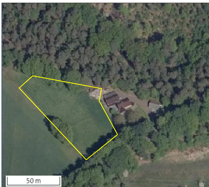
Begrenzing van het plangebied wordt met de gele lijn aangeduid.