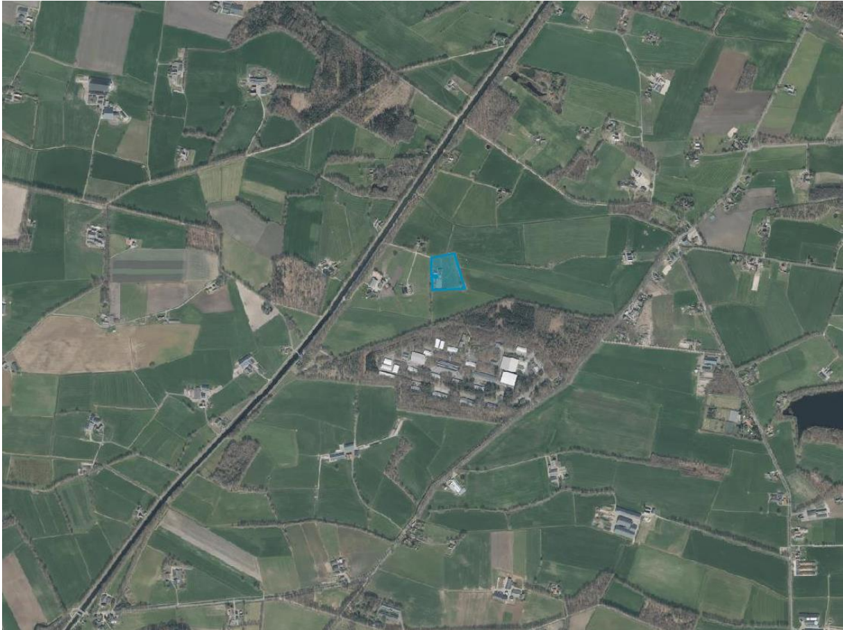
Figuur 1.1 Situering plangebied

De Heer Vos heeft MBH Consult B.V. opdracht gegeven voor het uitvoeren van een onderzoek stikstofdepositie ten behoeve van het realiseren van de nieuwbouw van een woning aan de Hietbergsweg 6 te Schalkhaar. In figuur 1.1 is een globale situering van het plan weergegeven.