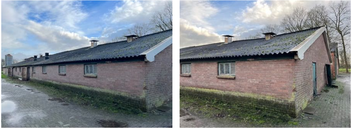
Figuur 2-3. Te slopen varkensschuur.