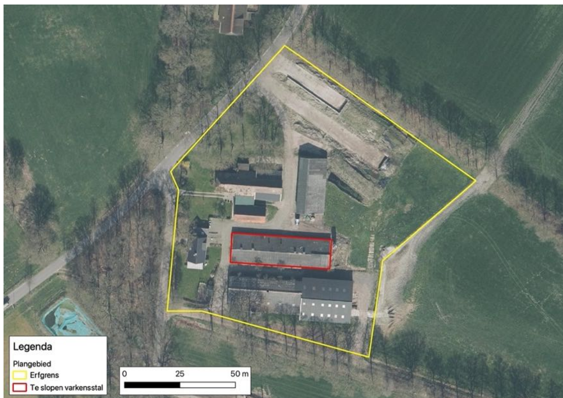
Figuur 1. Erf aan de Oerdijk 238 in Okkenbroek.

Aan de Oerdijk 238 in Okkenbroek (gem. Deventer) bevindt zich het erf van een voormalig agrarisch bedrijf. Het voornemen bestaat om een van de bedrijfsgebouwen te slopen. Omdat het gebouw van belang kan zijn voor beschermde soorten uit de Wet natuurbescherming is de locatie geïnspecteerd op aanwezigheid van beschermde soorten, (potentiële) vaste nest- en verblijfplaatsen en andere eventueel relevante zaken. De controle is uitgevoerd op 09-01-2023 door dhr. M. Bleijerveld.