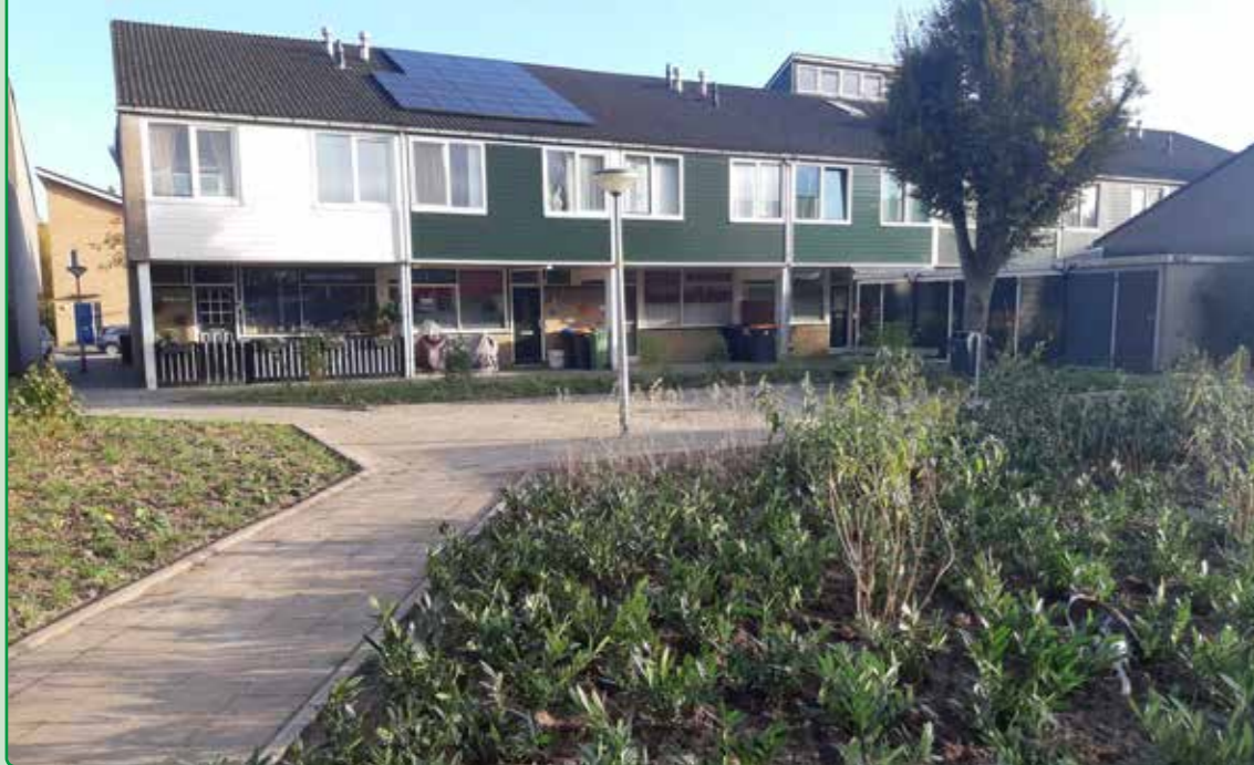
Op het pleintje aan de Swanenburg zal het in het voorjaar gaan groeien en bloeien