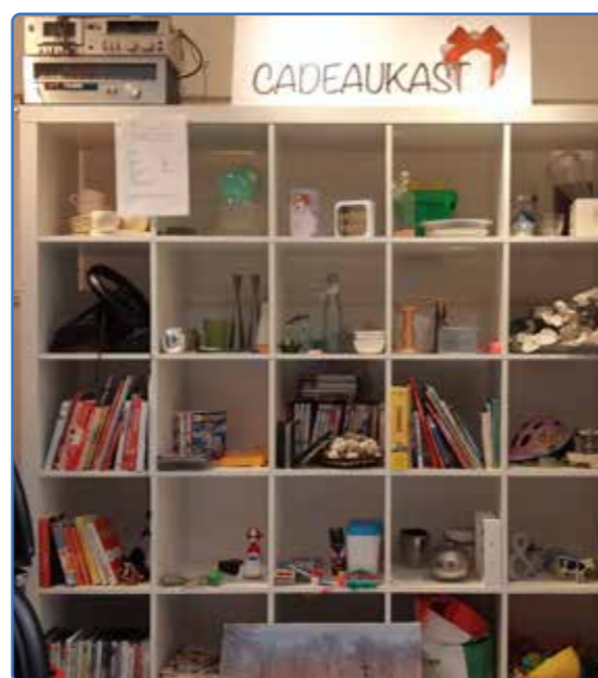
De cadeaukast in verbindingcentrum 5Hoek.