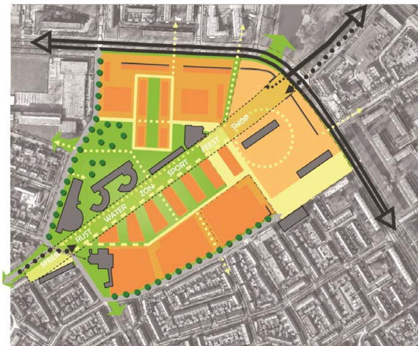
Plankaart vernieuwingsplan Keizerslanden-Centrum

In 2009 werd het "Vernieuwingsplan Keizerslanden-Centrum" vastgesteld. Naast een analyse van de bestaande situatie en een inventarisatie van bewonerswensen werd daarin de gewenste situatie beschreven en de stappen die moesten worden gezet. Dit heeft mede geleid tot uitgangspunten voor het in 2015 vernieuwde winkelcentrum, de geplande woningbouw op de onderhavige locatie en het transformeren van de Karel de Grotelaan naar Keizerspark.