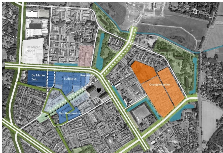
Ruimtelijke samenhang ontwikkellocaties (Ruimtelijke verkenning Keizerslanden 2020)