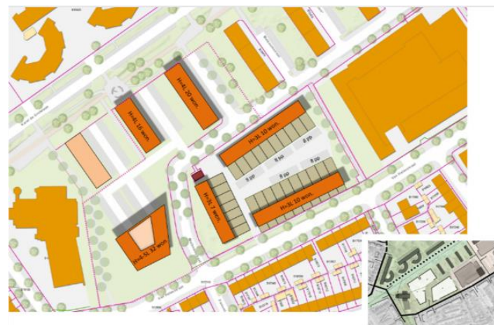
Optie B: sloop/nieuwbouw stadswoningen in vlek 3

Ook sloop van het gebouw en vervangende nieuwbouw van stadswoningen is een nog te onderzoeken mogelijkheid ( optie B ).