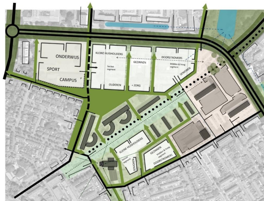
Plankaart Keizerslanden Centrum (Ruimtelijke verkenning Keizerslanden 2020)

Vanuit de Woningbouwopgave Keizerslanden is het de bedoeling om de Van Hetenlocatie te herontwikkelen naar woningbouw. Tot op heden is deze woningbouwambitie niet gerealiseerd en zijn de schoolgebouwen blijven staan en tijdelijk ingevuld met andere functies. De opgave is nu om alsnog op deze locatie van de drie schoolgebouwen op een passende manier de geprogrammeerde woningbouw en maatschappelijke buurtfuncties te realiseren.