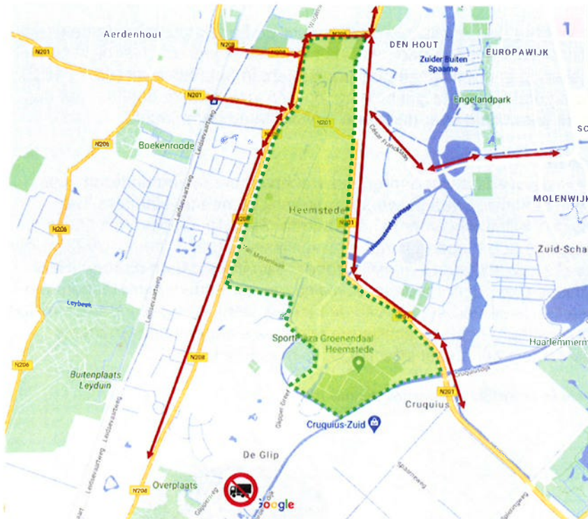
Figuur 2: Schets milieuzone en doorgaande routes vrachtverkeer Heemstede meer in detail

gedwongen via de Spanjaardslaan te rijden. Noord/zuid vrachtverkeer kan alleen via de Herenweg ten westen van het centrum van Heemstede en via de Cruquiusweg / Heemsteedse Dreef. Aanvullend kan overwogen worden om een verbod voor vrachtverkeer in te stellen voor de Glipperdreef / Glipperweg om vrachtverkeer vanuit het zuiden door De Glip te weren. Een schets van hoe de milieuzone en de doorgaande routes voor vrachtverkeer eruit kan zien is weergegeven in figuur 2. Het definitieve ontwerp van de milieuzone, de voorbereiding en de invoering moeten verder uitgewerkt worden met een participatietraject.