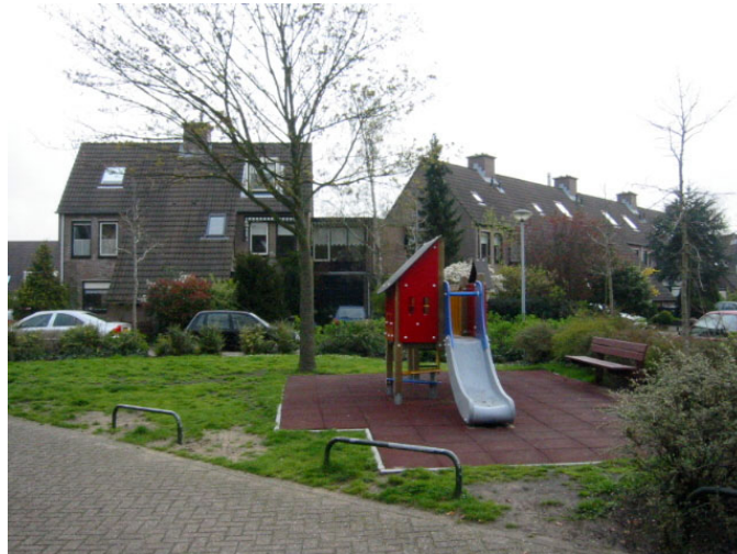
Afbeelding: speelvoorziening J. Westerdijklaan

Bij deze visie hoort een bijlagerapport. In deze bijlagen zijn uitwerkingen opgenomen ter ondersteuning van de hoofdstukken. Dit betreft enkele relevante regels en beleidsstukken, een omschrijving per speelplaats, een lijst met de afschrijvingstermijn van de speeltoestellen en het vigerende beleid. Terwijl het hoofdrapport gedurende langere tijd actueel zal blijven is het bijlagerapport sneller achterhaald en dient beschouwd te worden als lopend document dat geschikt is om regelmatig te actualiseren.