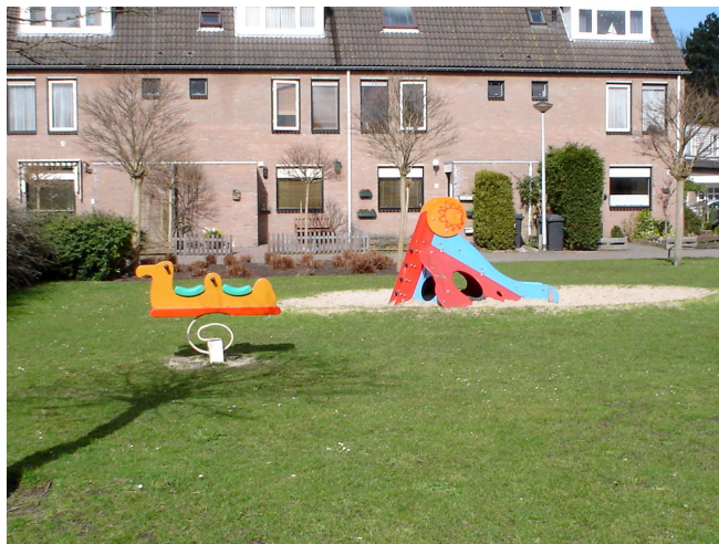
Afbeelding: speelvoorziening: A. Blamanlaan