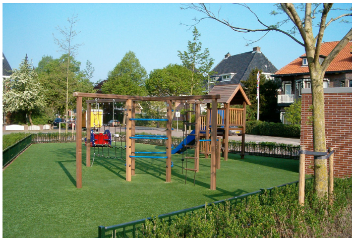
Speelvoorziening J.M. Molenaerplein