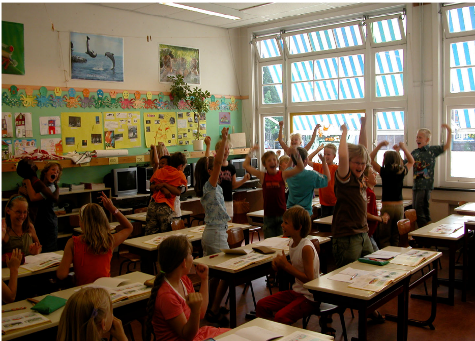
Winnende klas van de prijsvraag Speelvisie

Voor deze Speelvisie is het communicatietraject zoveel mogelijk afgestemd op de communicatieplanner ‘Groenprojecten’ die is opgesteld door de afdeling Communicatie. In de tabel op de volgende bladzijde is het communicatietraject terug te vinden. De genoemde punten 1 t/m 4 zijn in de voorfase doorlopen.