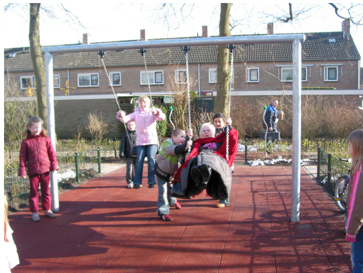
Afbeelding: opening speelplaats Korhoenlaan 25

Per locatie zal moeten worden bekeken welke valondergrond zal worden toegepast. Dit hangt af van de grootte van het toestel en de beschikbare budgetten. Er zal zoveel mogelijk worden gestreefd naar het leggen van groen kunstgras in een groene omgeving en rubber tegels in een stenige omgeving. Voor toestellen met een korte levensduur wordt vaker gekozen voor zand. De markt van valondergronden is echter nog steeds in ontwikkeling. Het is niet uit te sluiten dat op den duur andere producten op de markt komen die aanpassing van bovenstaand streven wenselijk maken.