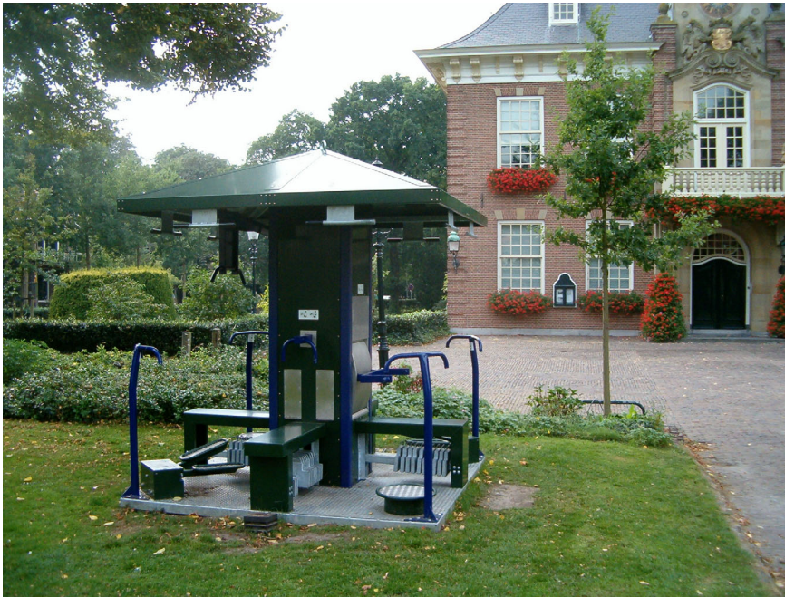
FIT-point bij het Raadhuis

Tenslotte wordt vanuit het taakveld van de ontwerper openbare ruimte creatief gekeken naar de mogelijkheden voor spelaanleiding in de openbare ruimte. Hiervoor hebben de ingediende reacties op de uitgeschreven prijsvraag een goede aanzet gegeven.