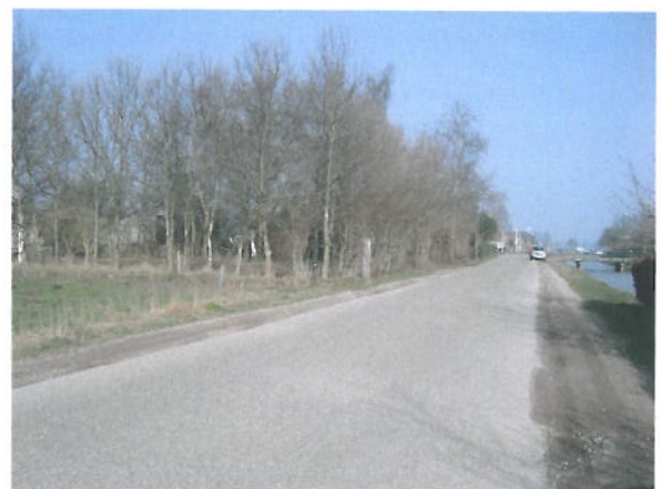
Foto 4: Elshofweg t.h.v. het plangebied. Rechts de Nieuwe Wetering.