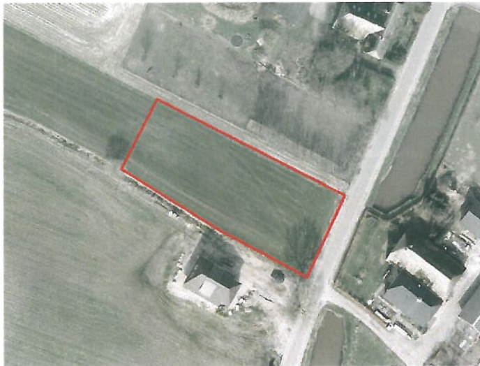
Figuur 2: Luchtfoto plangebied (rood).

Nadere details omtrent het plan zijn niet bekend. Waarschijnlijk gaat het om een vrijstaande woning. In het onderzoek is er vanuit gegaan dat het terrein in de huidige vorm verdwijnt.