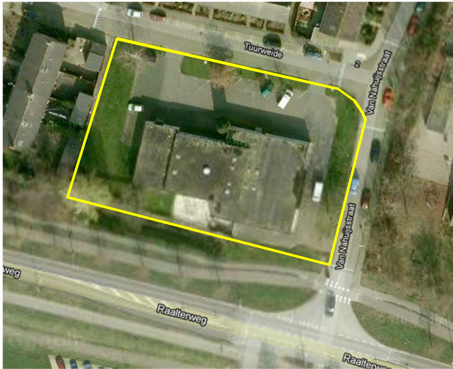
Detailopname van het plangebied. Het plangebied wordt met de gele lijn aangeduid.