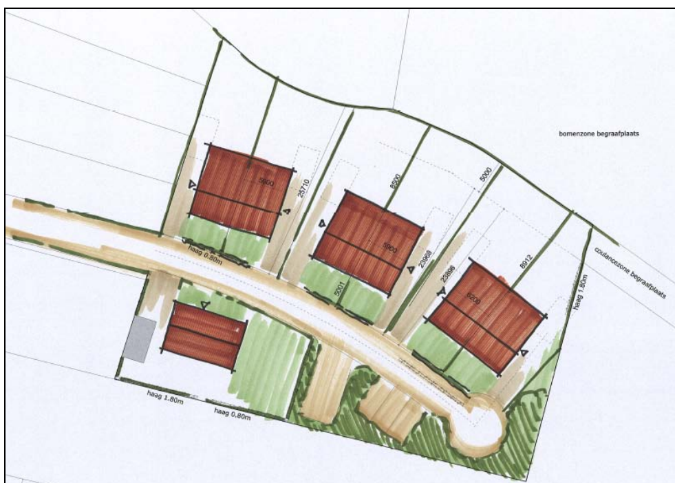
Figuur 2. De verkaveling voor de locatie Baltus

Omdat er sprake is van relatief grote kavels, kunnen grotere woningen worden gerealiseerd. De woningen staan in een relatief strakke rooilijn, om op die manier de eenheid in het buurtje te versterken.