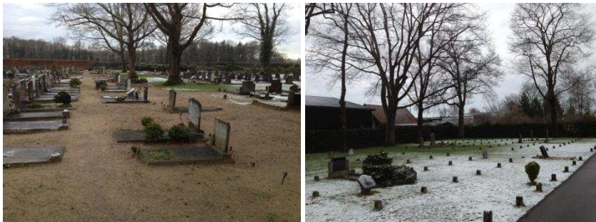
De begraafplaats in Den Nul

De herinrichting in 2006 – waarbij de begraafplaats ‘gebruiksklaar’ is gemaakt door onder andere de aanplant van beplanting - heeft onvoorzien tot hogere onderhoudskosten geleid, omdat die niet waren meegenomen bij de planvorming voor de reconstructie.