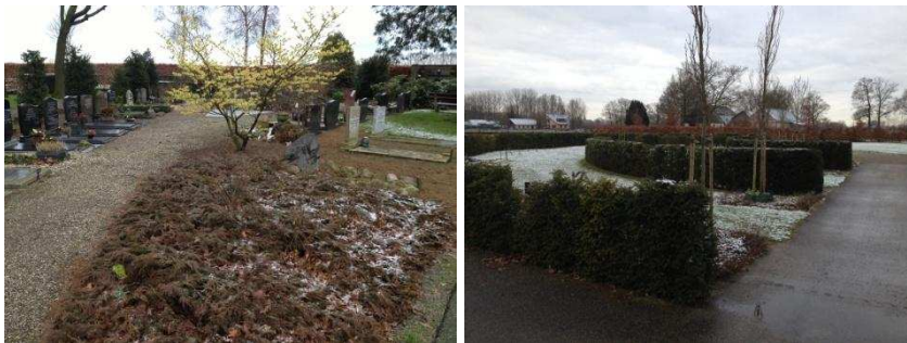
De begraafplaats in Wijhe

De begraafplaats kenmerkt zich door een hoog onderhoudsniveau, welke geclassificeerd is op een gemiddelde A-kwaliteit.