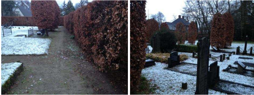
De begraafplaats in Olst