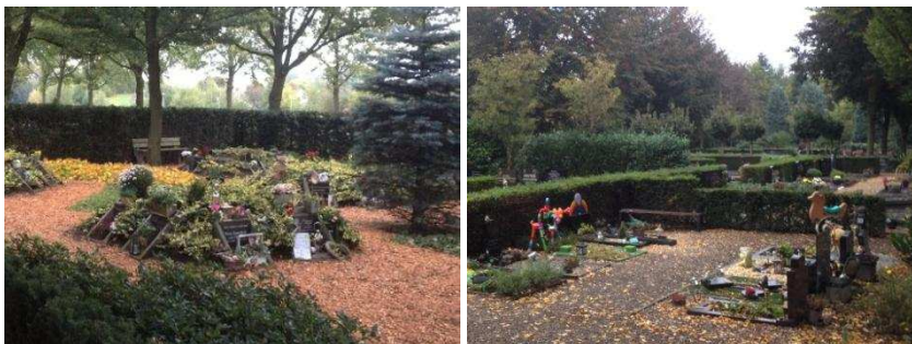
Urnenheuvels (links) en een speelvoorziening (rechts) op de Algemene Begraafplaats in Borne.

Voldoende aanbod in diversiteit is essentieel voor een florerende begraafplaats. Door voldoende alternatieven in begraven aan te bieden wordt de aantrekkelijkheid van de begraafplaatsen vergroot. Voor het aantrekkelijker maken van begraafplaatsen zijn tal van voorbeelden, zoals het toepassen van urnenheuvels (zie afbeelding), of het toepassen van gepaste speelvoorzieningen bij kindergraven (zie afbeelding). Dit is echter een greep uit tal van voorbeelden.