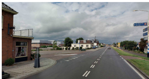
Figuur: N337-Veerweg vanaf zuiden (Deventer)

Vanaf de Veerweg belemmert 't Pannenkoekenhuis het zicht voor automobilisten naar rechts (zuiden), terwijl aan de linkerkant veel openheid is door het parkeerterrein. De bereikbaarheid/ontsluiting via de Veerweg op de N337 is voor vrachtverkeer matig vanwege een lastige draai op de smalle weg.