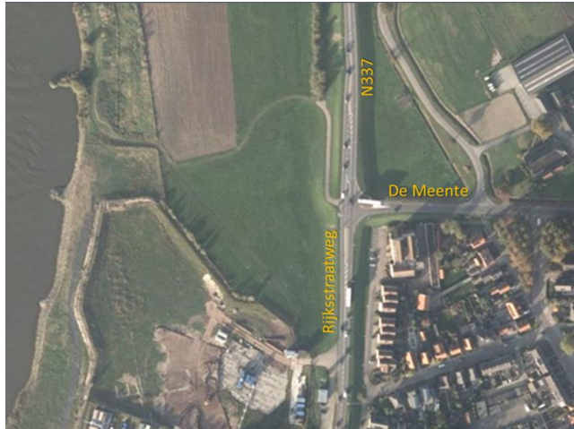
Figuur: Kruispunt N337 - De Meente, in het zuiden Abbott

Zoals in de aanleiding is beschreven wordt de ontsluiting van Abbott verplaatst ten noorden van het bedrijf. Deze ontwikkeling valt samen met het realiseren van een rotonde op het kruispunt N337 - de Meente. De rotonde wordt een viertaksrotonde, waarbij één tak richting het terrein van Abbott gaat.