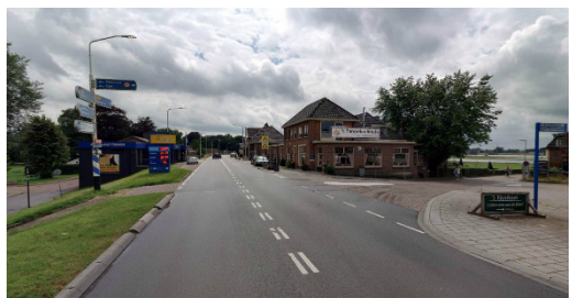
Figuur: N337-Veerweg vanaf noorden (Zwolle)

De N337 is een voorrangsweg, verkeer vanaf de Veerweg moet voorrang verlenen aan het verkeer op de N337.