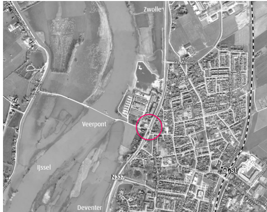
Figuur: Ligging van het kruispunt in de kern Olst

Verder inzoomend naar het gebied zijn een aantal functies aanwezig in de nabijheid van de route (zie onderstaande figuur):