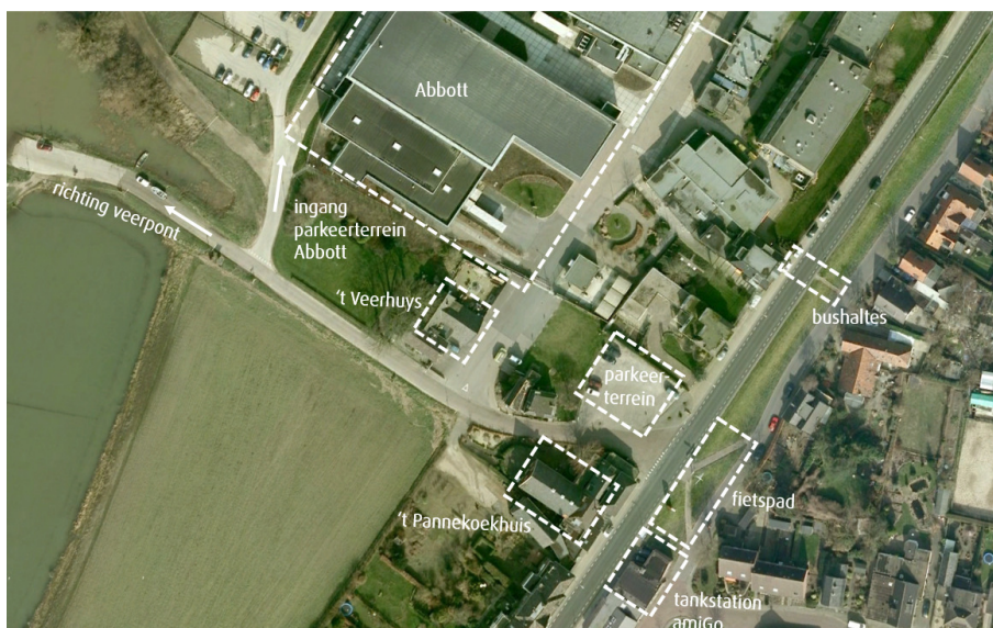
Figuur: Aanwezige functies nabij kruispunt