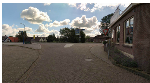
Figuur: Verkeersbord op N337 met 'pas op fietsers op de rijbaan' Figuur: Kruispunt vanaf de Veerweg

Voor fietsers is het toegestaan om op de rijbaan op te fietsen. Tevens is vanaf de Benedendijk een fietspad aangelegd om de N337 op te fietsen en/of naar bestemmingen aan de overzijde van de weg te komen, bijvoorbeeld de veerpont. Op de N337 zijn borden geplaatst om te waarschuwen voor fietsers op de rijbaan. Doorgaande fietsers worden via de kern Olst geleid, zij fietsen in Olst niet langs de N337.