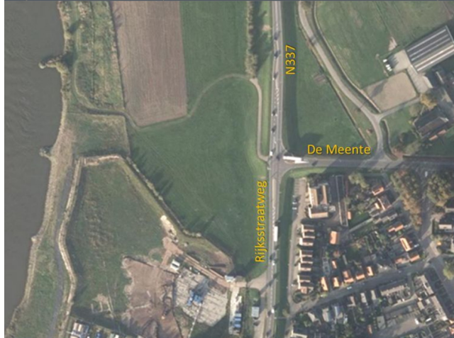
Figuur: Kruispunt N337 - De Meente, in het zuiden Abbott

Zoals in de aanleiding is beschreven wordt de ontsluiting van Abbott verplaatst ten noorden van het bedrijf. Deze ontwikkeling valt samen met het realiseren van een rotonde op het kruispunt N337 - de Meente. De rotonde wordt een viertaksrotonde, waarbij één tak richting het terrein van Abbott gaat.