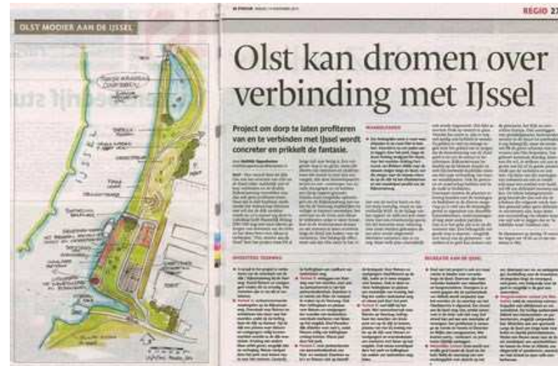
artikel De Stentor 14 november 2014

Om draagvlak te houden en te vergroten is een goede communicatie van zeer groot belang. In de definitiefase is een communicatieplan opgesteld, waarin een actorenanalyse is opgenomen. Uitgangspunt is dat alle communicatie vanuit PB Olst zal worden opgezet en dat dit op een zeer interactieve wijze zal gebeuren. Mede hierdoor blijven we allemaal in de afgesproken rol waarin PB Olst de initiatiefnemers is en dit project een burgerinitiatief is. Daarnaast krijgt PB Olst op die manier voeding vanuit de samenleving. Het blijft ook van belang om de verbinding te zoeken met de ondernemers, het bedrijfsleven en de politiek. Er wordt actief gecommuniceerd via bijeenkomsten en vergaderingen en via de pers, mail en Facebook. Niet alleen als de bijeenkomsten over dit specifieke onderwerp gaan, maar bijvoorbeeld ook als het gaat om de structuurvisie voor de komende jaren. Zodra concretisering dichterbij komt zal ook van Twitter gebruik worden gemaakt.