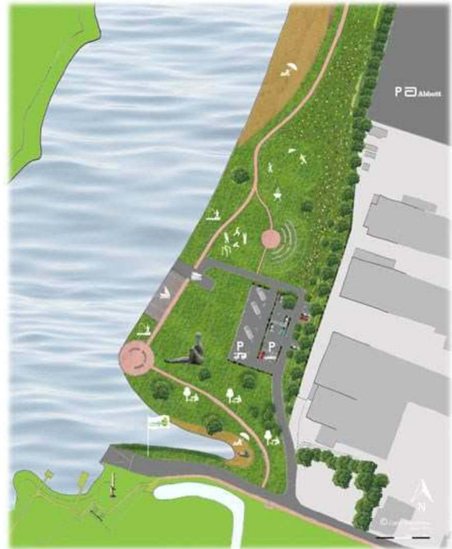
referentiebeelden inrichting IJsseloever