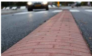
voorbeeld overrijdbare middengeleider

Gecombineerd met middengeleiders kunnen fietsers en voetgangers dan oversteken met eventueel een stop op de middengeleider. Door een andere inrichting van het kruispunt wordt verkeer gedwongen zich anders te gedragen. Vanaf de Veerweg kunnen zowel fietsers als voetgangers aan de rechterkant blijven en rechtdoor oversteken naar het plateau. Een voordeel van dit voorstel is ook dat de parkeerplaats bij het Pannekoekhuis gehandhaafd kan blijven, in het plan wordt wel een vernieuwde inrichting van de parkeerplaats voorgesteld.