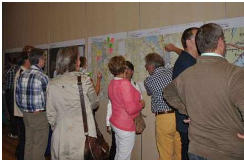
schets sessie met inwoners Olst 24 juni 2014 in Holstohuis

aanpak wordt doorgezet, hetgeen wil zeggen dat er na een haalbaarheidsstudie, een projectplan is geschreven en nu een voorbereidingsplan wordt opgesteld.