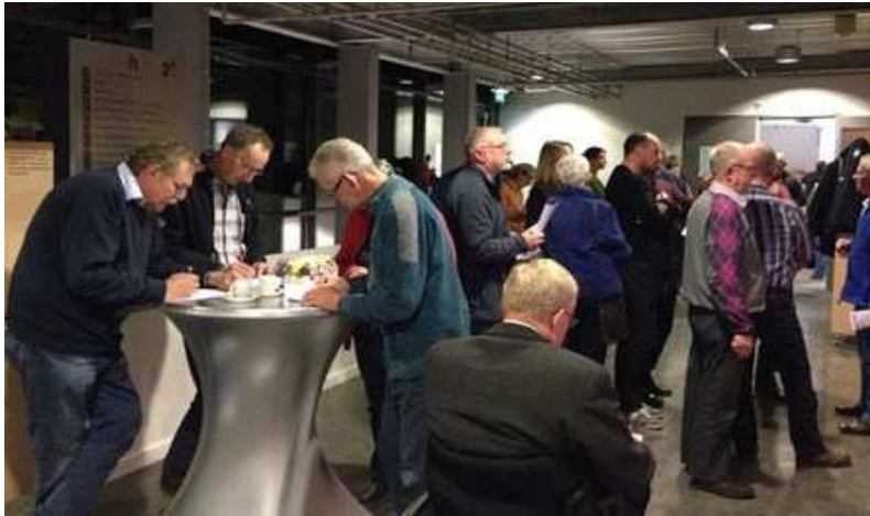
keuzeavond 18 november 2014