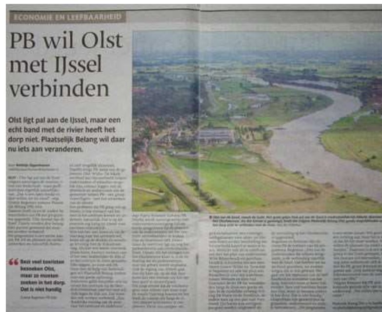
artikel De Stentor 21 december 2013

Deze uitvoeringslijn past dus prima in het eerste en derde gemeentelijke thema.