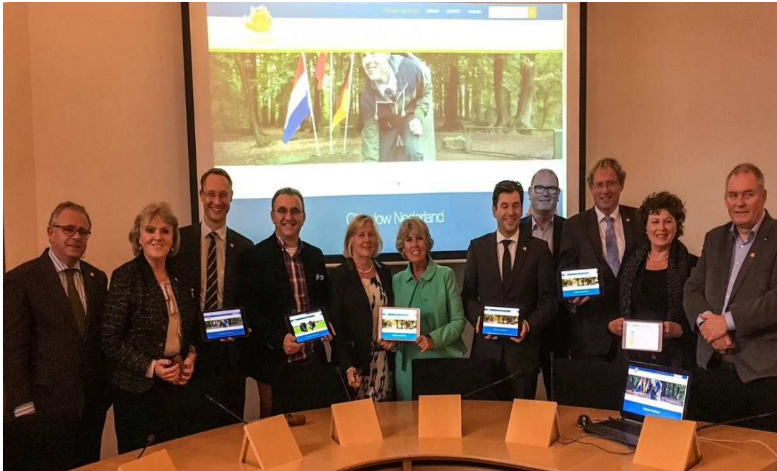
Nederlandse (o.a Heerde en Midden Delfland) en Duitse leden Cittaslow

In verband met de geografische spreiding en de exclusiviteit was het uitgangspunt van het Nederlandse Cittaslow netwerk dat één gemeente per provincie kon toetreden. Nadat een redelijke spreiding was bereikt is in 2015 besloten om deze beperking van één gemeente per provincie los te laten. Meer gemeenten (tot 50.000 inwoners) per provincie kunnen nu lid zijn van het Nederlandse Cittaslow netwerk.