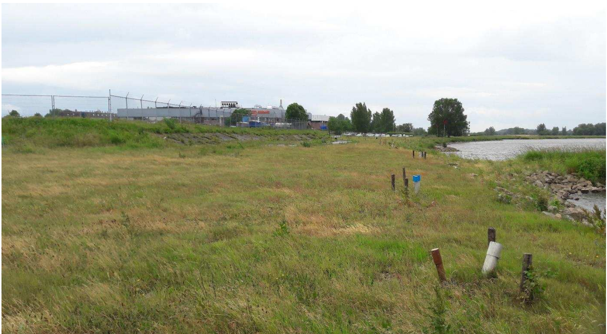
Figuur 3: Indruk van het plangebied ter hoogte van de ONW