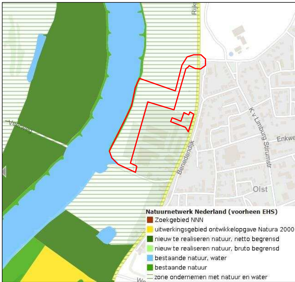
Figuur 4: situering van het van NNN-gebied t.o.v. het plangebied (rode contour; bron kaart: Pdok.nl)