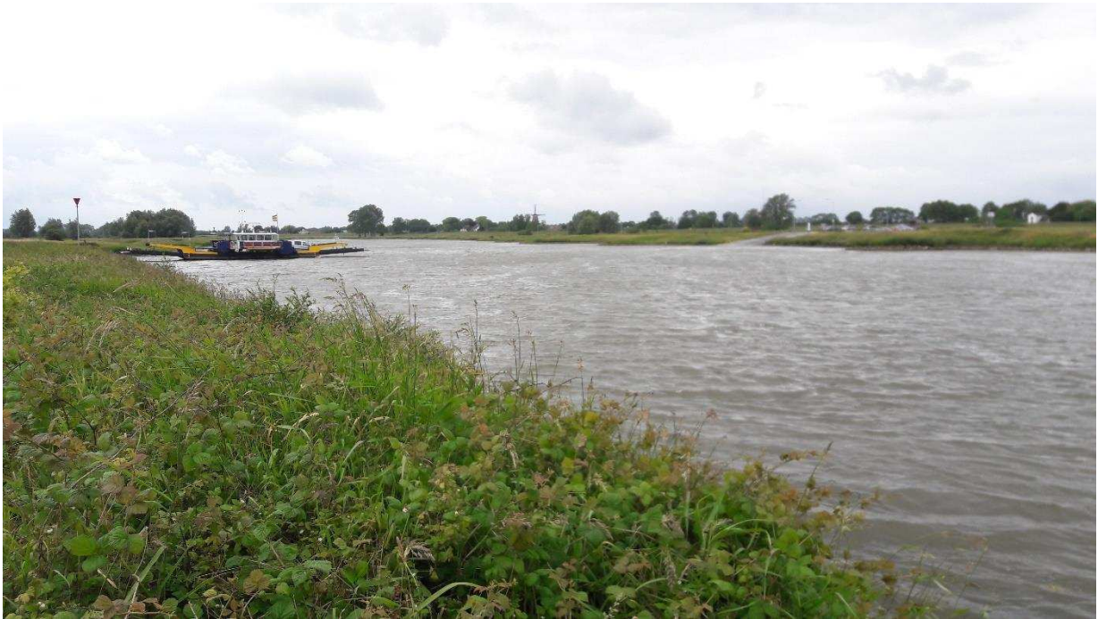
Figuur 2: Indruk van het plangebied ter hoogte van de ruigtestrook