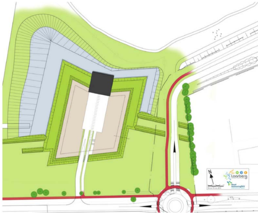
Figuur 2.2: toekomstige situatie (grijs = gebouwen, groen = groeninrichting van het terrein)