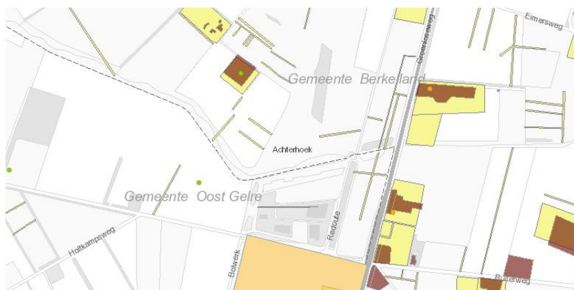
Figuur 2.3: Aanwezige bodeminformatie Geoweb omgevingsdienst regio Achterhoek

In figuur 2.3 is een uitsnede opgenomen van het Geoloket van de omgevingsdienst regio Achterhoek. Hieruit blijkt dat op het perceel een asbestonderzoek is uitgevoerd. Uit de resultaten blijkt dat het perceel niet asbest verdacht is. De gegevens van het asbestonderzoek zijn opgenomen in BIS4-all projectnummer 8957 d.d. 4-1-2006. De sloot aan de westzijde van het perceel is in het verleden opgenomen in het historisch bodembestand. Bij navraag bleken hiervan geen gegevens beschikbaar.