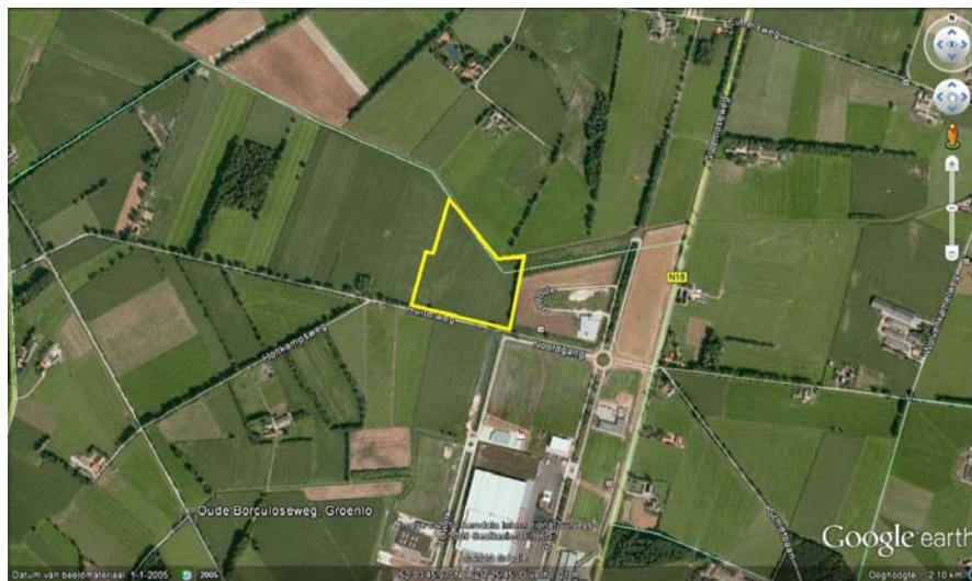
Figuur 2.1: ligging onderzoeksgebied

Het gebied is kadastraal bekend als gemeente Groenlo, sectie F, nummer 780 en is in gebruik als akkerland. Figuur 2.1 geeft een overzicht van de ligging van het onderzoeksgebied. De onderzoekslocatie ligt aan de noordrand van de bebouwing in Groenlo en is gelegen op bedrijventerrein Laarberg.