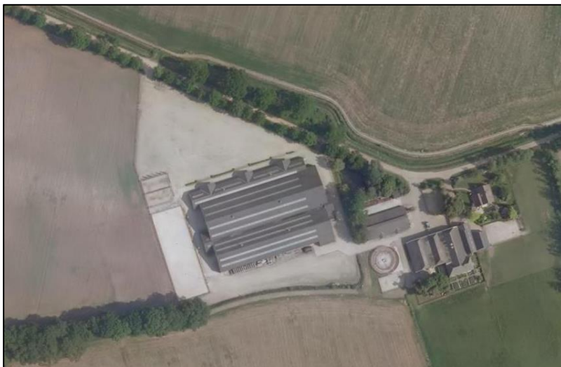
Figuur 1 Luchtfoto locatie Weijenborgerdijk 34

Een luchtfoto en topografische kaart met daarop de ligging van het bedrijf aan de Weijenborgerdijk 34 is in onderstaande figuren opgenomen.