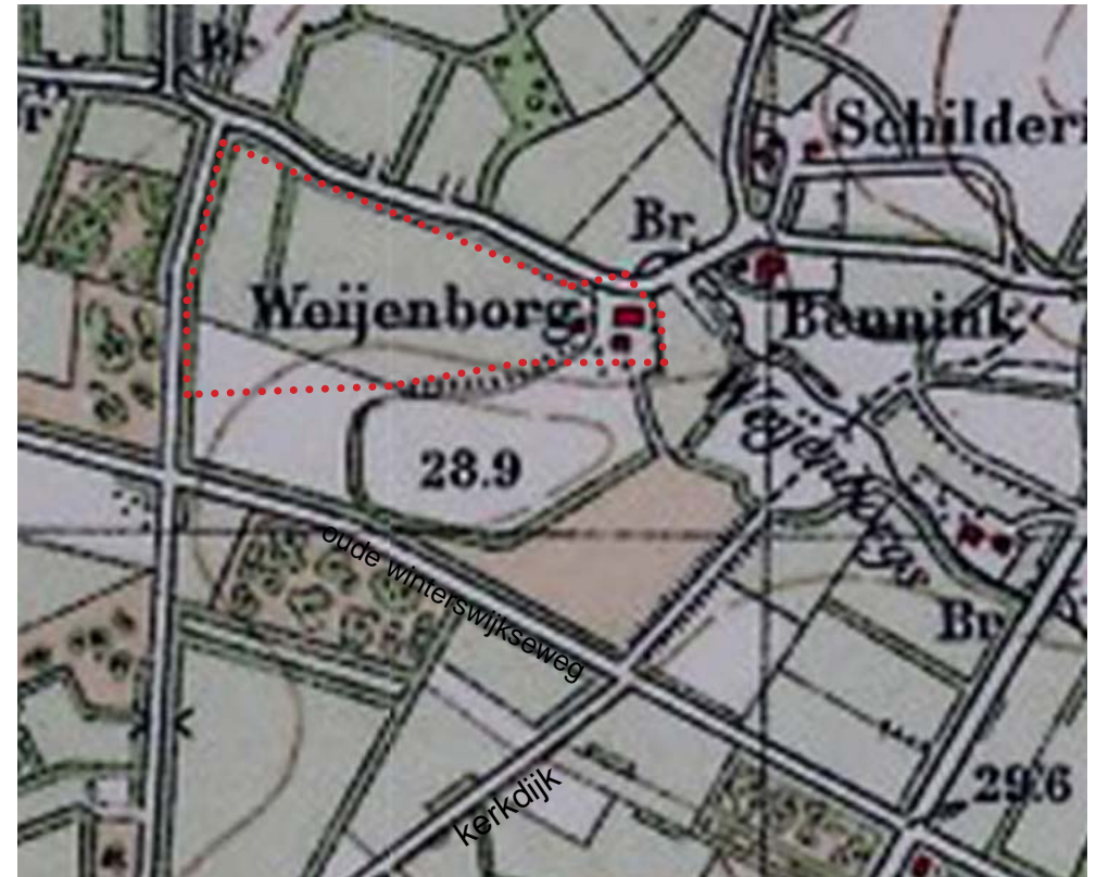
Historische topkaart 1927

“Weijenborg” is nog grotendeels (natte) heide. De kamp aan de zuidkant van “Weijenborg” wordt omringd door een singel/haag. De wegen tussen de heidegronden liggen er, maar de grond is nog nauwelijks ontgonnen. Het erf “Weijenborg” maakt deel uit van een groepje van drie erven op de flank van de grote es. De kamp hoort hier met de omsingeling duidelijk bij. Op deze kaart is goed het verschil te zien tussen het kampenlandschap met de grillige verkaveling en oude erven en de heideontginningen met de rechte wegen en zonder bebouwing.