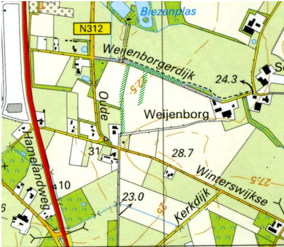
Huidige topografische kaart.