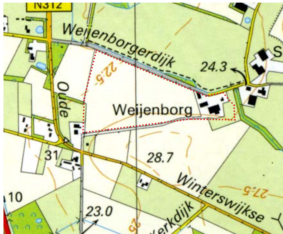
Huidige topografische kaart.

“Weijenburg” is één grote kavel. Van de singel/haag langs de weg aan de linkerzijde is weinig over. Er is een pad aangelegd vanaf de weg links naar het erf. Hierlangs zijn op de kaart bomen aangegeven. De kamp is onaangetast maar de singel is in z'n geheel verdwenen. Links naast de kamp is een productiebosje aangeplant.