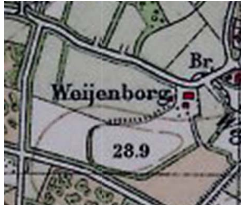
Kaartbeeld 1927