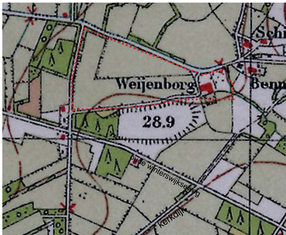
Historische topkaart 1936