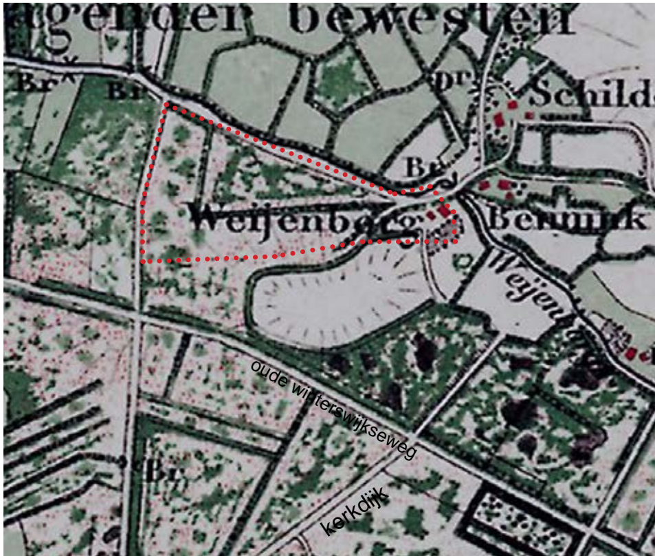
Historische topkaart 1885