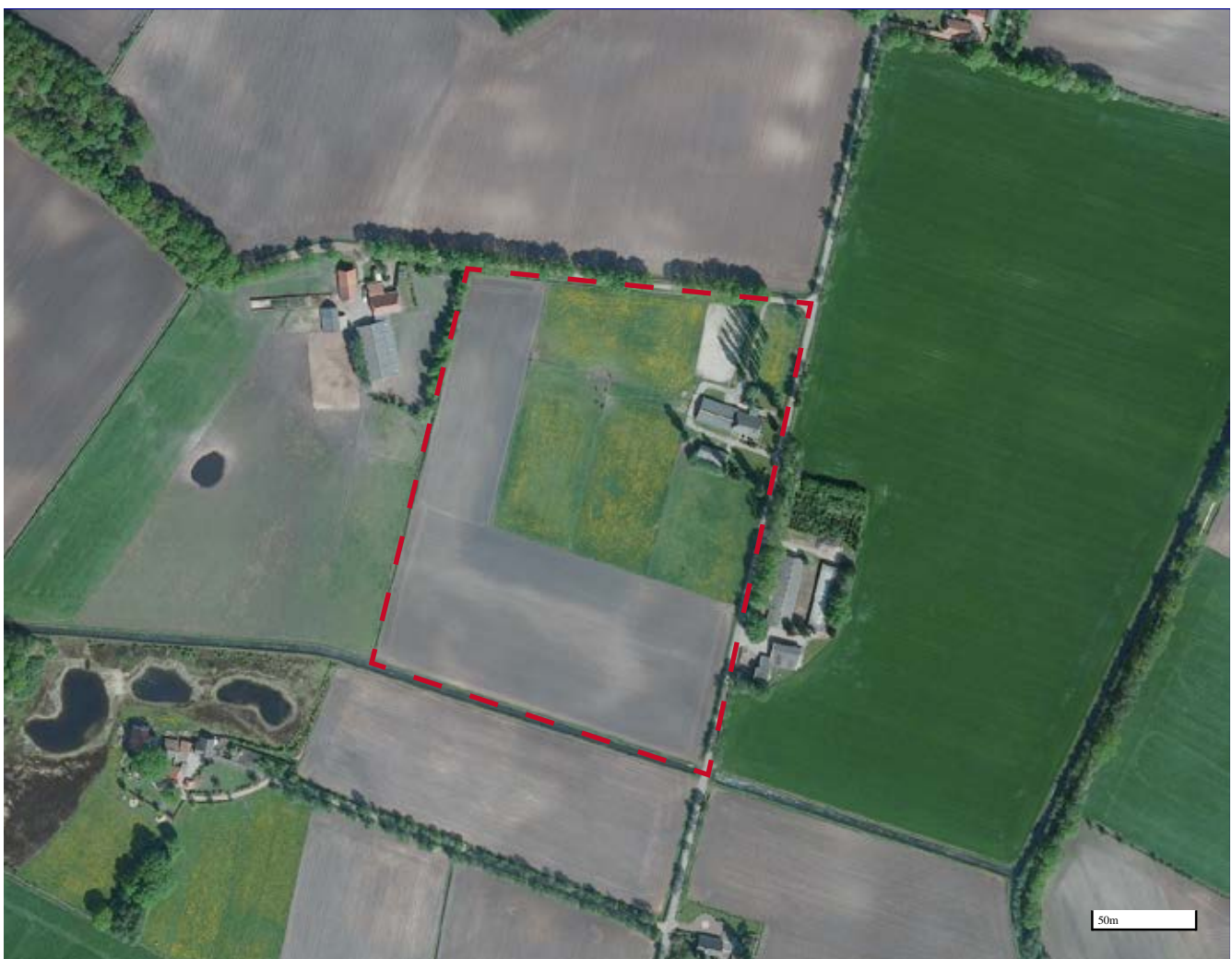
De situatie aan de Nicolaasweg 3 Harreveld.

De boerderij ligt ten noord-westen van Harreveld. Het landschap ter plekke is te omschrijven als jong ontginningslandschap. Kenmerken van dit type landschap zijn de lijnvormige kavelverdelingen waarbij de bebouwing aan de weg ligt en landschappelijke lijnvormige elementen als bomenrijen, hout en struweelsingels op de kavelgrenzen.