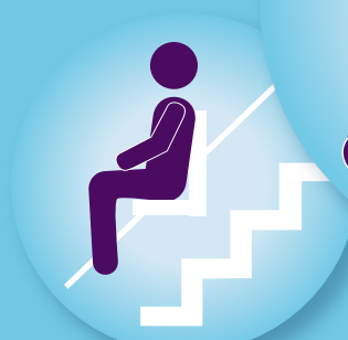
Bijvoorbeeld een traplift