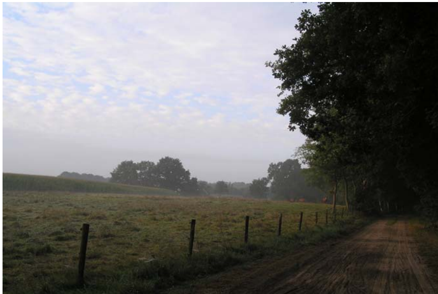
Figuur 1. Karakteristiek beeld in de Achterhoek.

Gemeente Oost Gelre is stil zonder bedrijvigheid te beperken