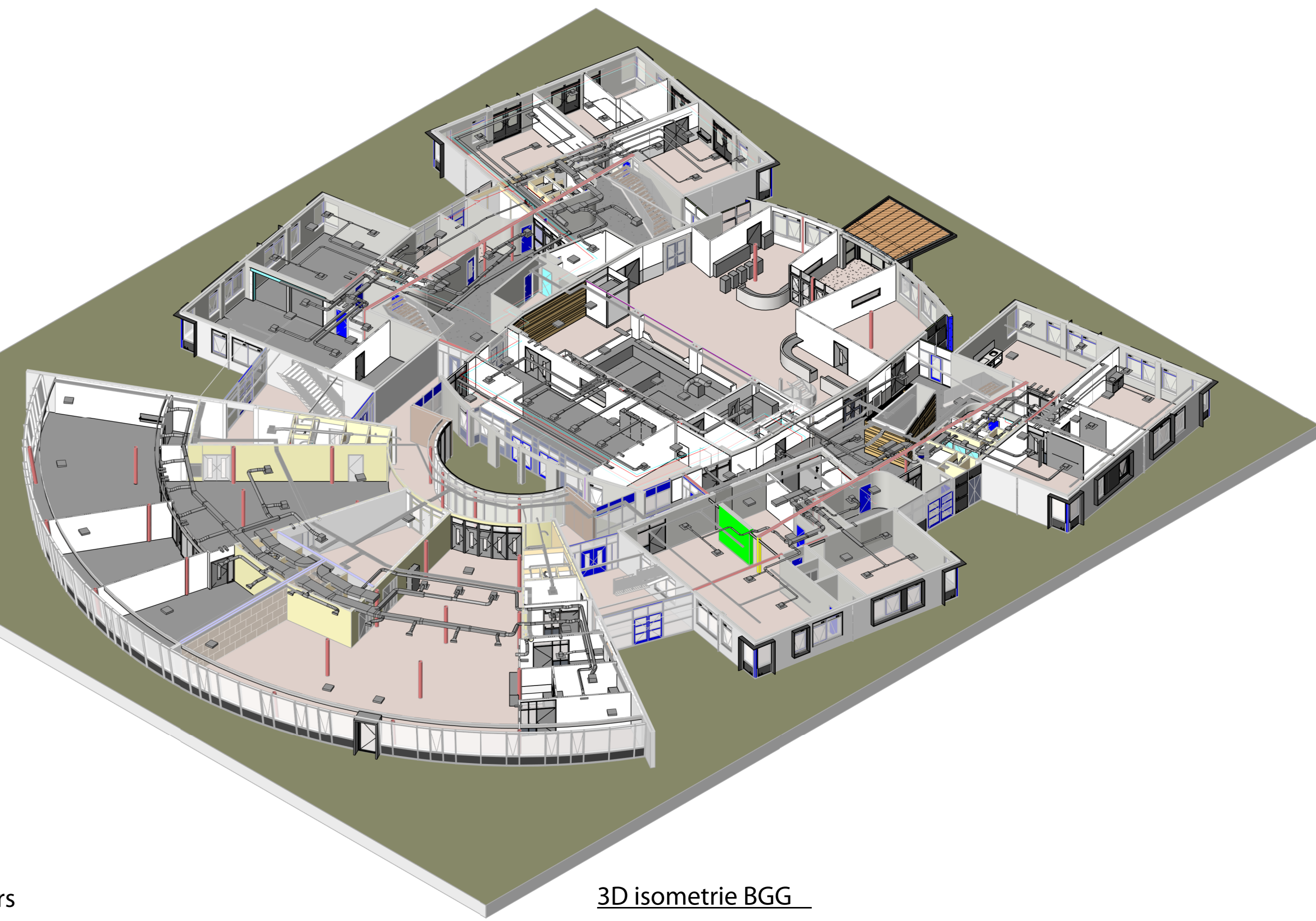
3D isometrie BGG