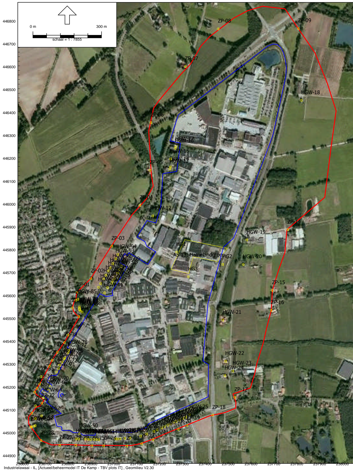
Industrieterren met zone en bewakingspunten (zonegrens = rood, industrieterreingrens = blauw)