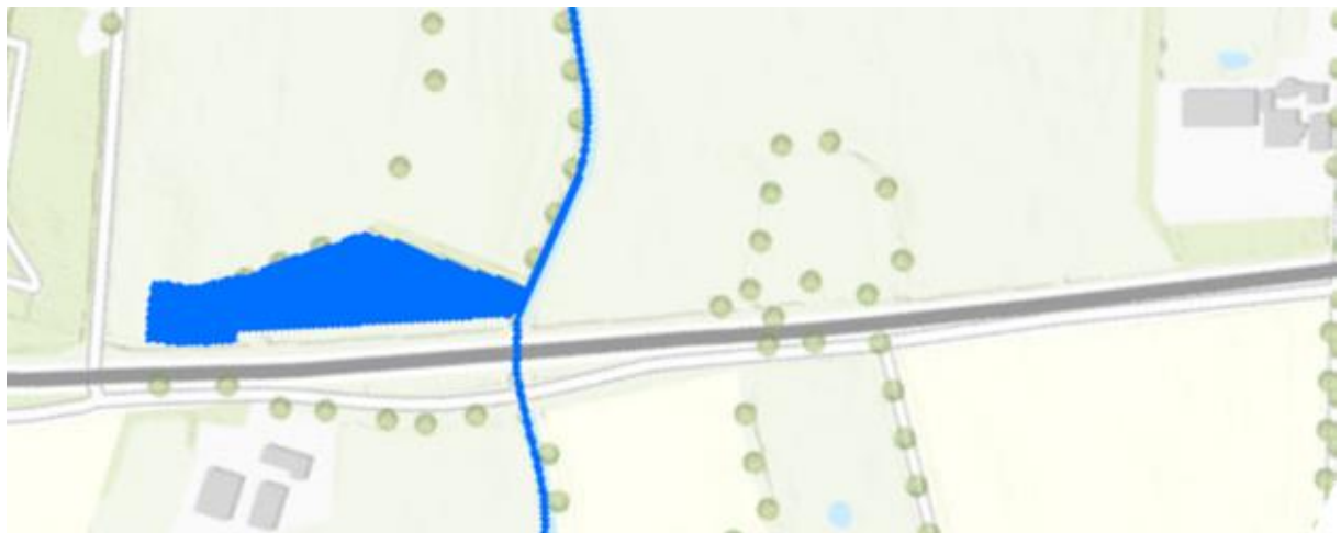
Afbeelding 1. Uitsnede leggerkaart met ligging primaire watergang

Voor de realisatie van bovenstaande maatregelen is het noodzakelijk om een aantal watergangen aan te passen. Tevens is er sprake van een toename van het verhard oppervlak. Een deel van de werkzaamheden kent overlap met een primaire watergang (inclusief beschermingszone) in het beheer bij het waterschap. Zie onderstaande afbeeldingen voor de ligging van deze watergang (afbeelding 1) en de relatie van het wegontwerp tot deze watergang (afbeelding 2).