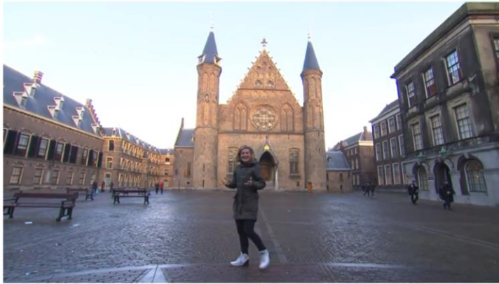
Hoe werkt een democratie? | Het Klokhuis