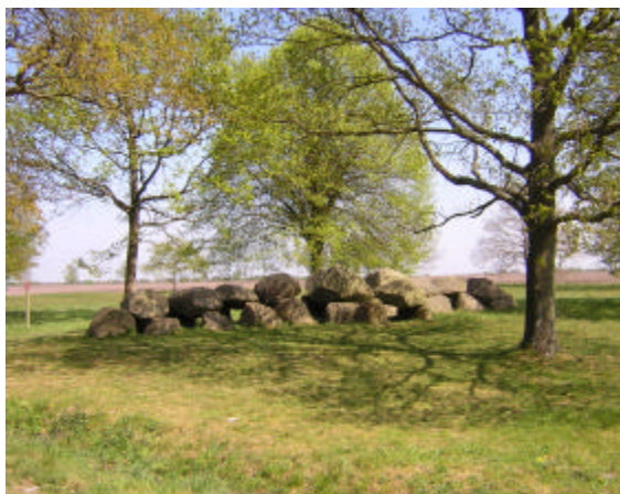
Hunebed bij Balloo

Op de achterzijde van deze routebeschrijving worden een aantal wetenswaardigheden beschreven. De nummers komen overeen met die van de routebeschrijving.