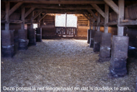
Deze potstal is net leeggehaald en dat is duidelijk te zien.

5 De Balloër es; Dit is een van de mooiste essen van Drenthe . De essen werden op de hoger gelegen en dus drogere gebieden aangelegd. De schapen leverden naast wol ook mest. In de verdiepte stal, vormde zich in de loop der weken een dikke vaste laag van mest en strooisel. Als de potstal vol raakte werd de mest op de es gebracht.