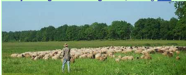
Herder met schapen op Balloërveld