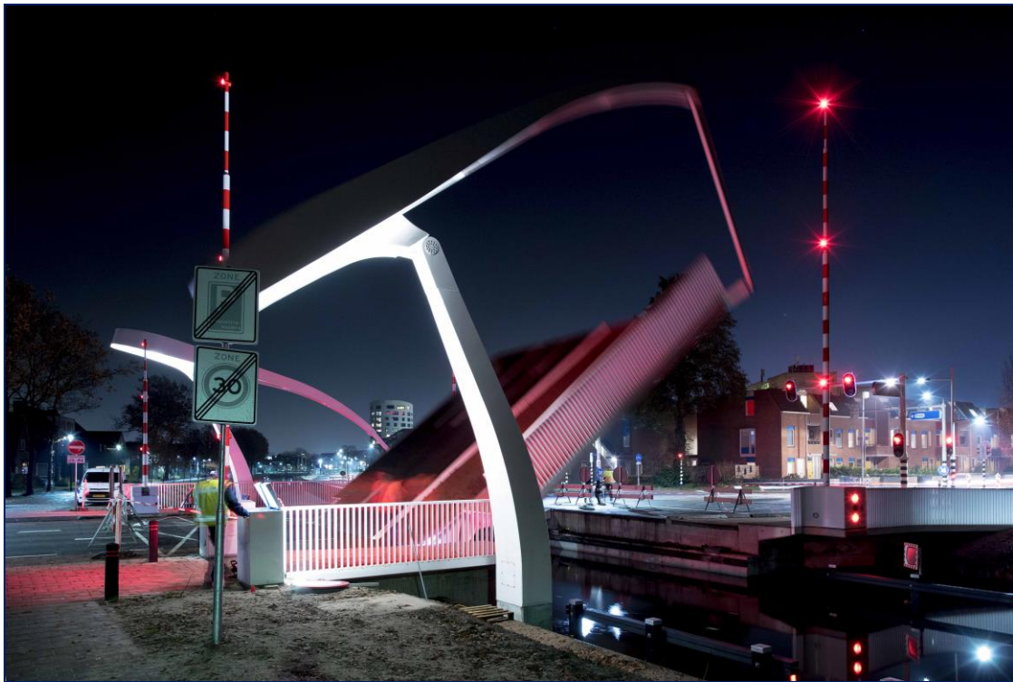
de Weiersbrug 'by night'

Eind november is het hydraulische systeem van de Weiersbrug uitgebreid getest. Dat gebeurde in de avonduren. Hierdoor was de Weiersbrug een aantal avonden afgesloten. Voor het eerst was ook de geïntegreerde LED-verlichting in de brugleuningen te zien. Dat leverde een mooi plaatje op. Begin januari volgt nog een 2 e korte testperiode. Om het verkeer niet te hinderen gebeurt dit werk zoveel mogelijk in de avonduren.