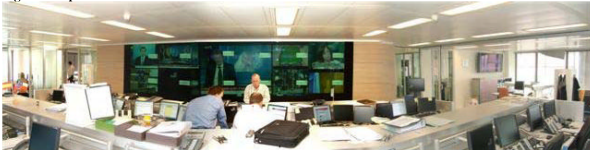
Figuur 1: Operationeel Centrum van het vernieuwde NCC