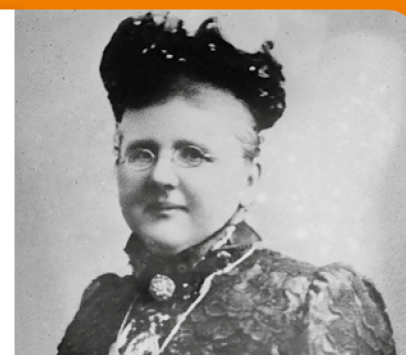
Koningin Emma stelde de Orde van Oranje-Nassau in

Kent u ook iemand die een lintje verdient? Binnenkort start de aanvraagprocedure weer voor de lintjes die in 2021 uitgereikt worden. Hoe u dat aanpakt kunt u binnenkort lezen in het gemeentenieuws.