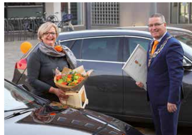
Al vroeg op pad om 16 inwoners te verrassen