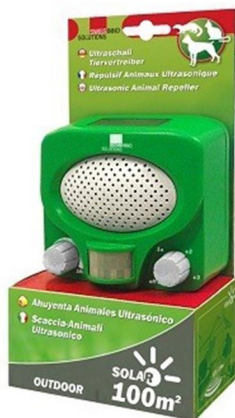
Fig: Een 'kattenverjager' voor particulier gebruik van nog geen € 50

Mosquitosystemen zijn er echter ook in toenemende mate in de handel verkrijgbaar als 'particuliere versie', meestal als doel om katten uit tuinen te weren. Tegenwoordig is een dergelijk apparaat al voor nog geen € 50 te koop voor privégebruik. We hebben sterk het gevoel dat de klachten over het gebruik van dit soort systemen aan het toenemen zijn.