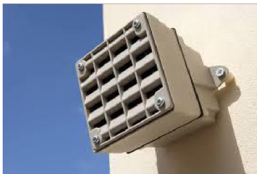
Fig: Een professioneel systeem tegen hanggroepjongeren dat vaak in de openbare ruimte wordt gebruikt

Professionele mosquitosystemen zijn in de afgelopen jaren in meer dan 100 gemeenten in de openbare ruimte gebruikt als middel om lokaal overlast van hanggroepjongeren te bestrijden. Doordat locatie, gebruiksfrequentie, tijdstip van gebruik onder 'overheidscontrole' plaatsvindt zijn de negatieve effecten redelijk geborgd, al zijn er ook zeker in dergelijke situaties klachten en (principiële) tegenstanders die vinden dat je goedwillende mensen en jeugdigen zo niet uit de openbare ruimte moet weren. Er zijn ook de nodige gemeenten die daarom het gebruik weer hebben afgeschaald op zelfs stopgezet.