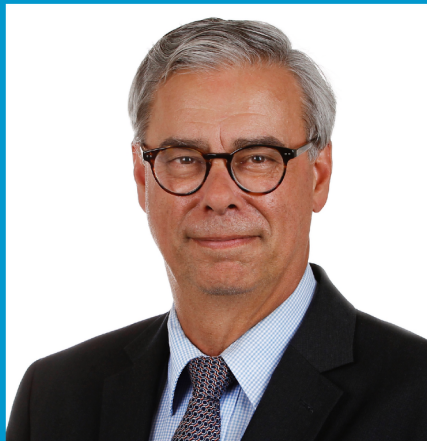
Burgemeester gemeente Waalre Voorzitter basisteam Kempen

De zorg voor veiligheid is een kerntaak van de gemeente. Die verantwoordelijkheid dragen we samen met vele partners. Veiligheid is veel omvattend en gaat om zaken waar inwoners dagelijks (bewust en onbewust) mee te maken krijgen. Denk daarbij aan veiligheid tijdens grote evenementen of de wetenschap dat de brandweer op tijd arriveert bij een brand, maar ook vervelende zaken zoals fietsendiefstal, woninginbraak, geweldpleging of de verwevenheid van de onderwereld met de bovenwereld. Veiligheid is een basisvoorwaarde voor een aantrekkelijke woon-, werken leef- gemeente en voor een goede economische en sociale ontwikkeling. De gemeente moet niet alleen veilig zijn, inwoners moeten zich ook veilig voelen.