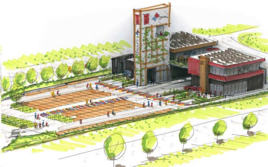
Impressie bouwplan vanuit Meerenakkerweg (voorheen Heistraat)

Om de ontwikkeling mogelijk te maken, is een nieuw bestemmingsplan nodig. Het ontwerpbestemmingsplan heeft ter inzage gelegen van vrijdag 29 januari 2021 tot en met donderdag 11 maart 2021. Tijdens deze termijn zijn 516 zienswijzen ingediend. Hiervan zijn er 40 zienswijzen 'uniek'. De overige 476 zienswijzen zijn gelijkloidend en (grotendeels) gebaseerd op een 'modelzienswijze' van de actiegroep 'HeistraatZoomVerzet'. Uw raad is bevoegd om bestemmingsplannen vast te stellen. Ook is uw raad bevoegd te oordelen over de ingediende zienswijzen. De planvorming is nu zover dat het bestemmingsplan aan uw raad kan worden aangeboden om deze te laten vaststellen.