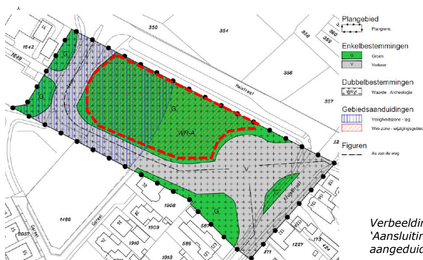
Verbeelding bestemmingsplan 'Aansluiting Kruisstraat' met daarin aangeduid de huidige ontwikkellocatie

In het nu geldende bestemmingsplan 'Aansluiting Kruisstraat' heeft het plangebied van voorliggend bestemmingsplan de bestemming 'Groen' met een wijzigingsbevoegdheid om deze bestemming te kunnen wijzigen naar kantoorfuncties, maatschappelijke functies, dienstverlening of bedrijfsdoeleinden.