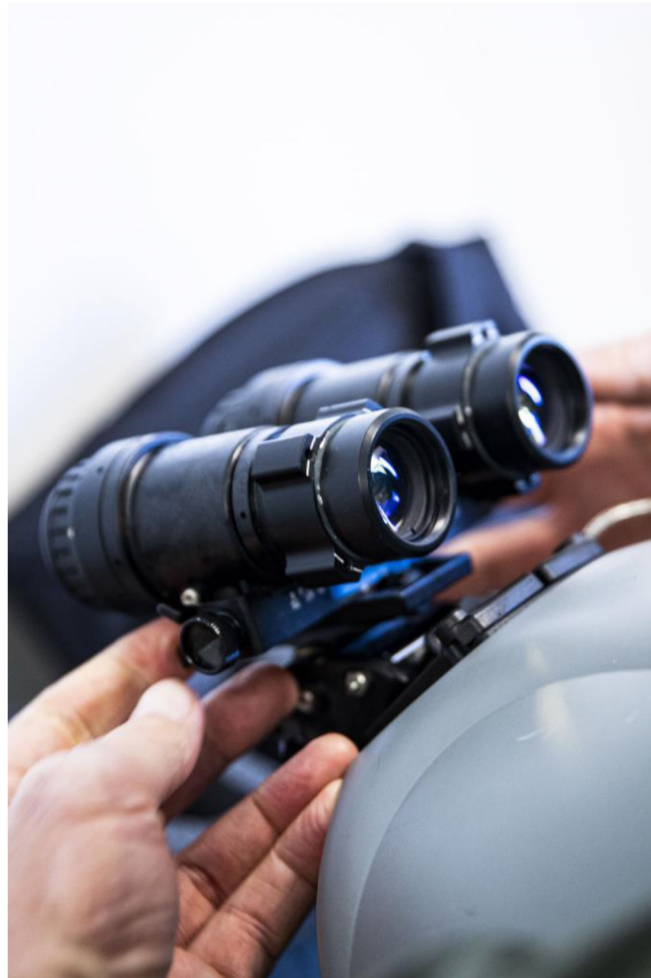
Night Vision Goggles worden gemonteerd op de helm van de vlieger

het in de meeste gebieden aardedonker. Een NVG is dan een waardevol instrument dat onder andere helpt tijdens het navigeren.