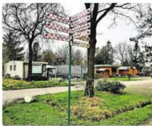
▲ Vakantiepark 't Witven in Veldhoven.