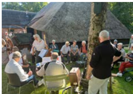
• Mondharmonica en trekzakfestival tijdens CityFest