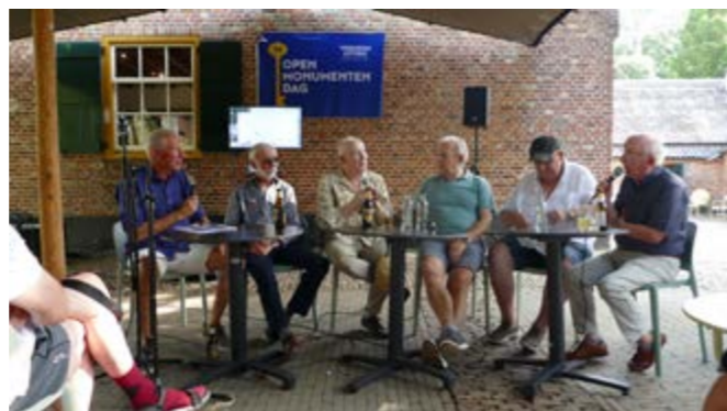
• De leden van de bekende groep 'the Evergreens' tijdens de Open Monumentendag in september