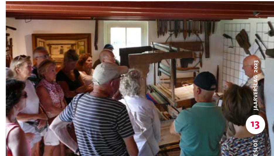
• Rondleiding in het bakhuisje