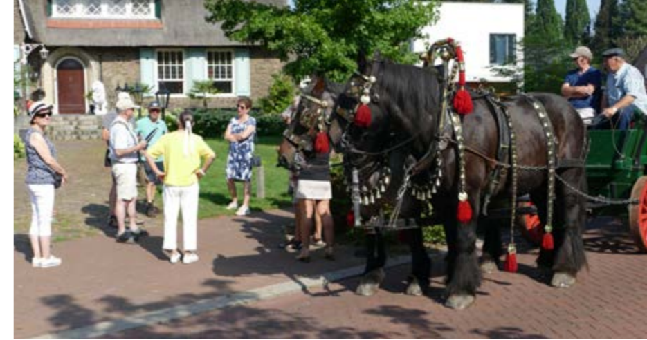
• Rondleiding door Zeelst tijdens Open Monumentendag