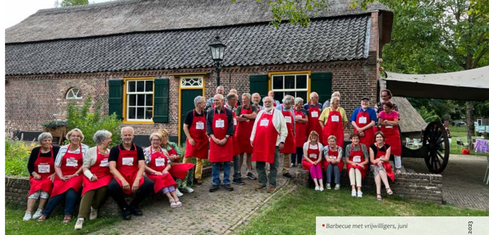
• Barbecue met vrijwilligers, juni