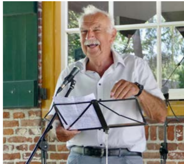
• Open Monumentendag