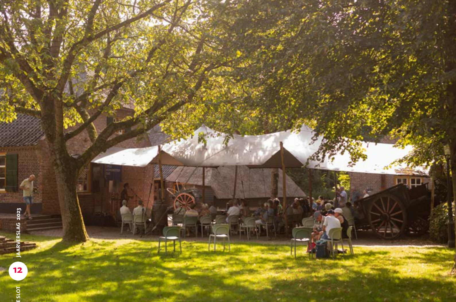
• Open Monumentendag