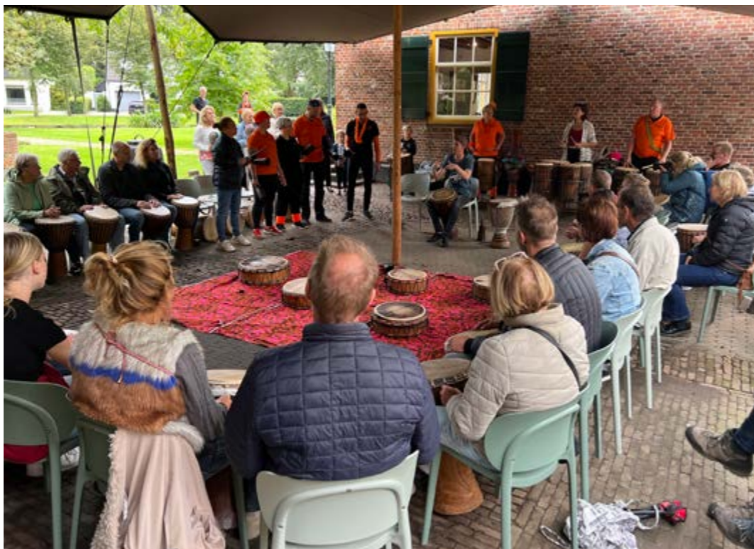
• Workshops tijdens City Fest, trommelen met de groep!