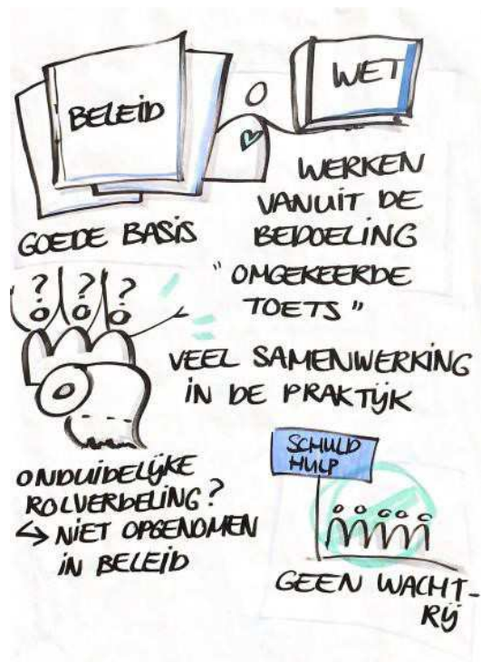
Afbeelding 2 illustratie presentatie Meedenksessie 6 april 2023