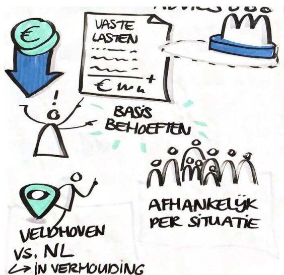
Afbeelding 1 illustratie presentatie Meedenksessie 6 april 2023

Weer een geheel andere indicator vormt het aantal gezinnen en personen, dat gebruik maakt van de Voedselbank. Ultimo 2022 ging het om 450 personen en 150 gezinnen, zoals op te maken is uit onderstaande figuur uit het Jaarverslag van de Voedselbank.