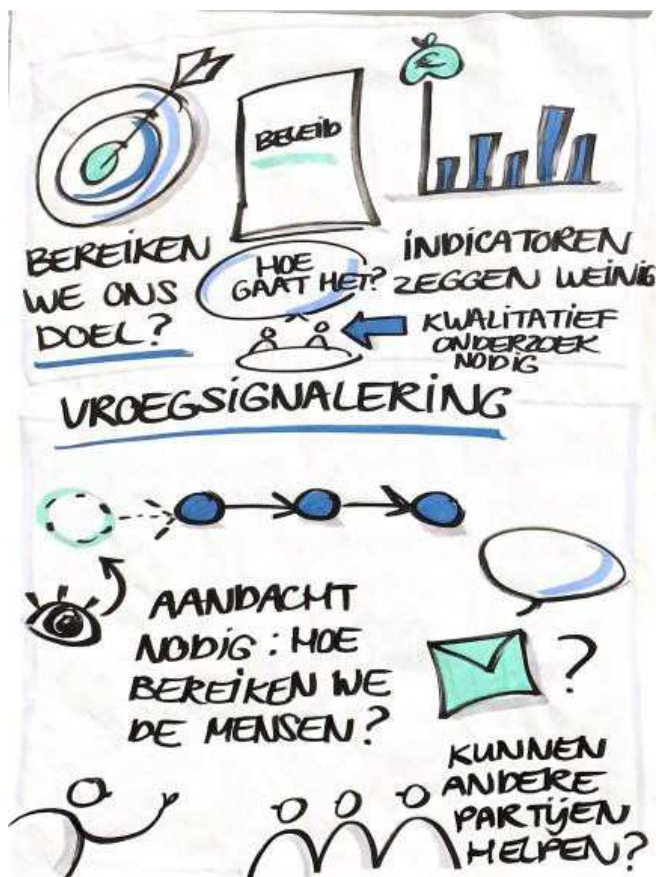
Afbeelding 3 Illustratie presentatie Meedenksessie 6 april 2023