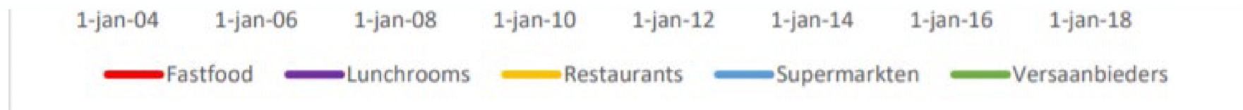
Figuur 2: Toe- of afname aantal voedselaanbieders 2004-2019