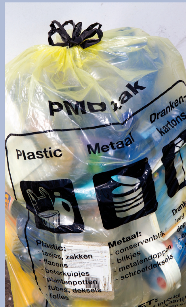
De PMD-zak is het nieuwe inzamelmiddel voor plastic, metaal en drinkkartons

De raadsvergadering van 1 september ging vooral over de nieuwe inzamelmethode van afval en de financiële positie van de gemeente. Met 'RaadsNieuws' heeft de gemeenteraad van Veldhoven een eigen medium. De artikelen bevatten geen letterlijk verslag, maar een impressie van de raadsvergadering. Ze zijn geschreven door een onafhankelijk journalist in opdracht van de gemeente.