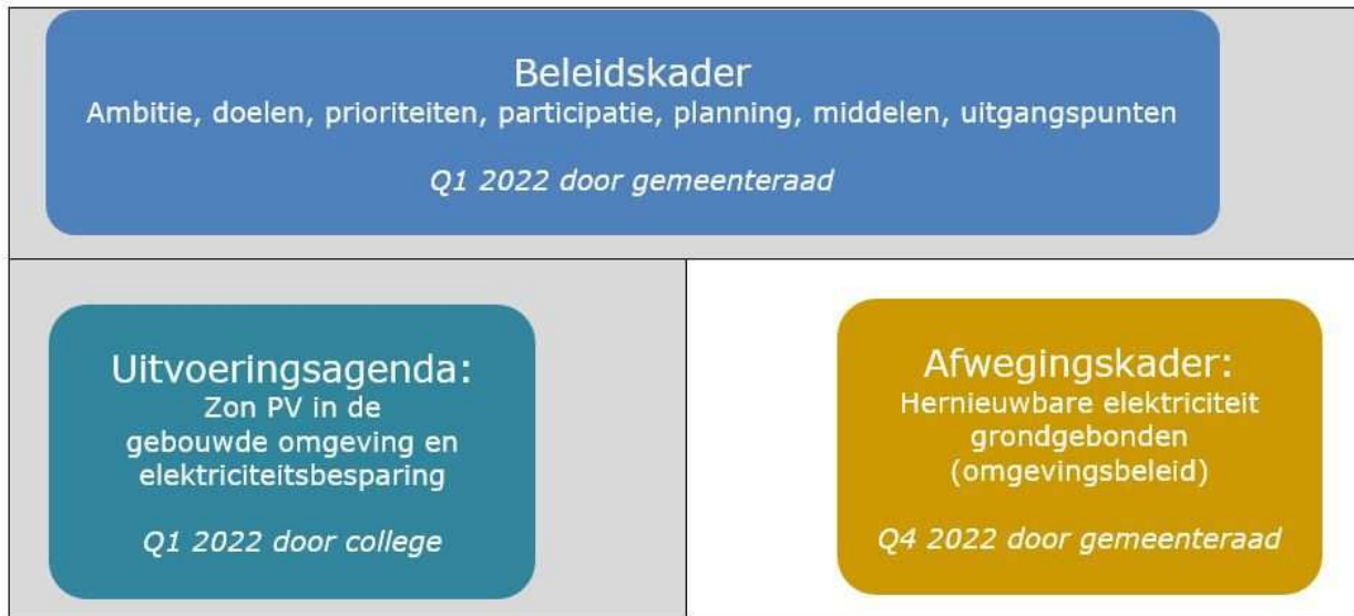
Figuur 1 | Beleidskader in relatie tot uitvoeringsagenda en afwegingskader