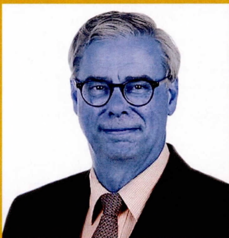
Burgemeester gemeente Waalre Voorzitter basisteam Kempen

De zorg voor veiligheid is een kerntaak van de gemeente. Die verantwoordelijkheid dragen we samen met vele partners. Veiligheid is veel omvattend en gaat om zaken waar inwoners dagelijks (bewust en onbewust) mee te maken krijgen. Denk daarbij aan veiligheid tijdens grote evenementen of de wetenschap dat de brandweer op tijd arriveert bij een brand, maar ook vervelende zaken zoals fietsendiefstal, woninginbraak, geweldpleging of de verwevenheid van de onderwereld met de bovenwereld. Veiligheid is een basisvoorwaarde voor een aantrekkelijke woon-, werk- en leef- gemeente en voor een goede economische en sociale ontwikkeling. De gemeente moet niet alleen veilig zijn, inwoners moeten zich ook veilig voelen.