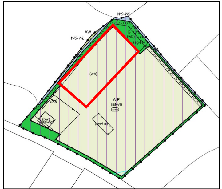
Afbeelding 2: Aangepaste ligging van de aanduiding waterberging (roodomlijnd)

b. Het waterschap geeft aan dat artikel 14.2 (voorwaardelijke verplichting waterberging) geen rekening houdt met eventuele toekomstige wijzigingen in beleid van gemeente of waterschap. Het waterschap verzoekt daarom om artikel 14.2 van de regels te vervangen door de volgende tekst: