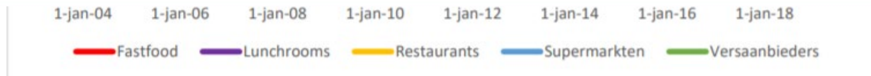
Figuur 2: Toe- of afname aantal voedselaanbieders 2004-2019