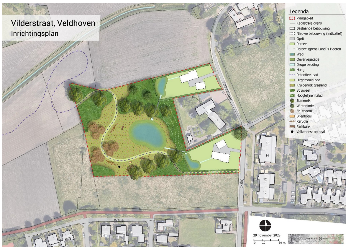
Afbeelding 1: Inrichtingsplan Vilderstraat te Veldhoven

Er wordt een voorwaardelijke verplichting in de regels opgenomen opgenomen die borgt dat zowel de kwaliteitsverbetering als de inpassing wordt aangelegd en in stand wordt gehouden. Afbeelding 1 toont de inrichtingstekening van de manier waarop de landschappelijke kwaliteitsverbetering wordt ingevuld.