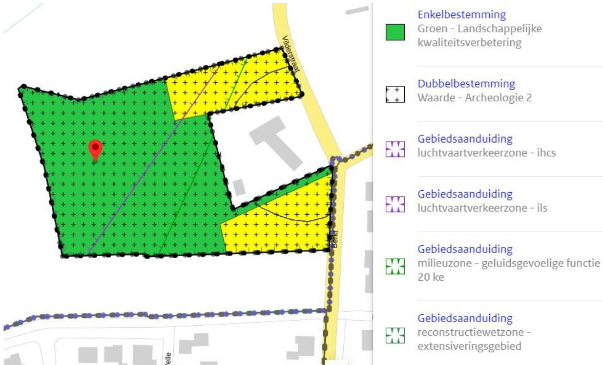
Afbeelding 2: verbeelding ontwerpbestemmingsplan 'Vilderstraat'

Afbeeldingen 2 en 3 tonen de verbeelding voor en na de doorgevoerde wijzigingen.